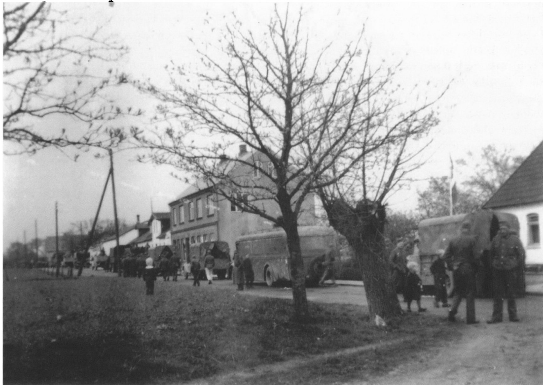
Tyske soldater på vej gennem Aastrup den 5. maj 1945.