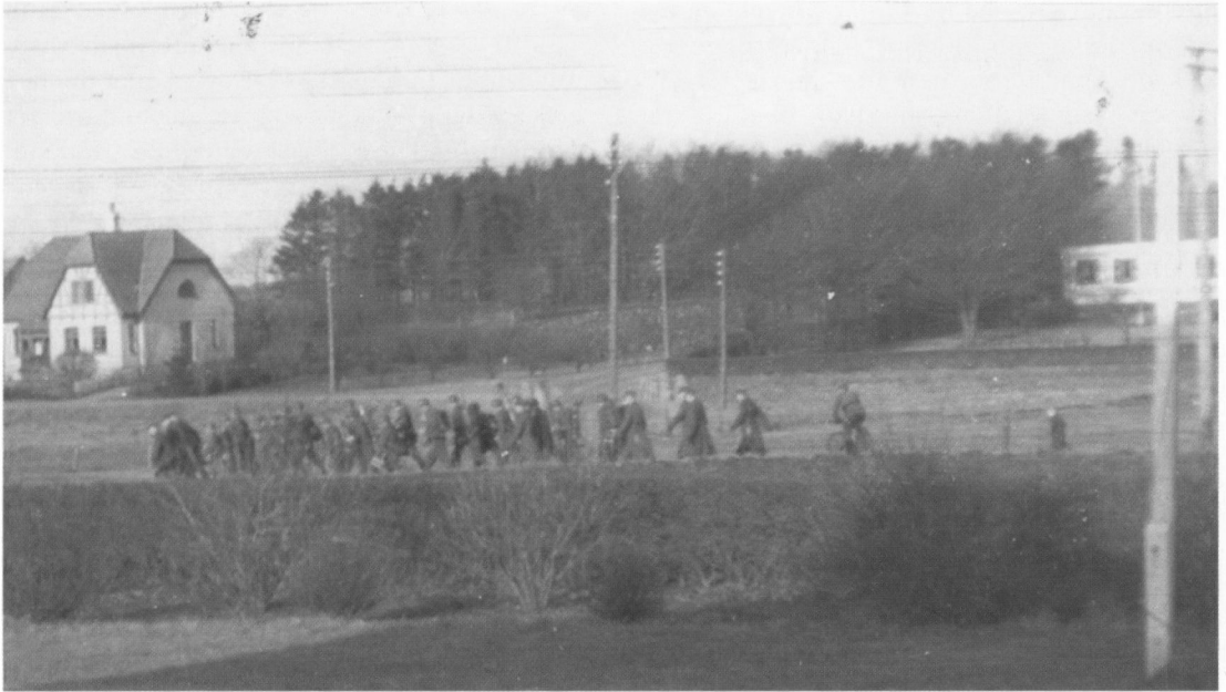
Tyske soldater på vej fra Klelund til Aastrup skole 1944.