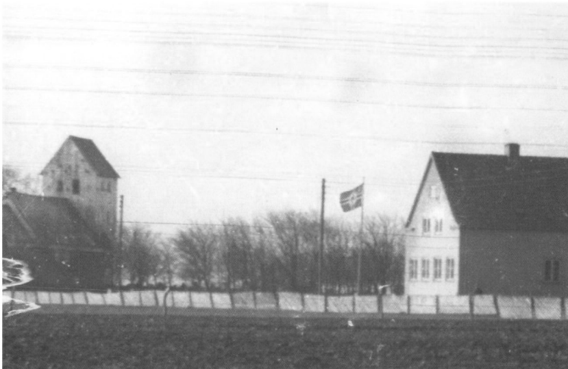
Aastrup skole 1944 med det tyske flag hejst.

Officererne havde i december 1943 inspiceret terrænet. Nu kom entreprenør Gravesen og begyndte at rive hegnspælene op og anlægge vej fra Frydensvang ind til en større hedeblade på ca. 125 tdr. land i den såkaldte Dyrehave Mose ind mod Fåborg sogneskel. Det havde ikke gjort noget stærkt indtryk på bønderne, at grænsepælene blev revet op den 9.5.1940, men nu da det var deres egne hegnspæle, så var det straks noget andet, og det bragte dem i affekt. Der kom straks 20 mand i arbejde, fem fra Aastrup og 15 fra Agerbæk, med en løn af 1,81 kr. i timen plus akkord. Ingen arbejder havde tilsyneladende betæneligheder eller skrupler derved. De forstod ikke, at de faktisk lavede ris til deres egen rumpe. Senere, da de begyndte at forstå dette, pralede de med, at de faktisk ikke bestilte noget. Men lønnen fik de. Den moral har siden været gængs her ude på landet i arbejderkredse og har sæt en dårlig sæd i dansk arbejderstand. Entreprenøren var en af dem, der havde arbejdet længst for tyskerne her på engen. Han hævdede at han egentlig ikke ville,