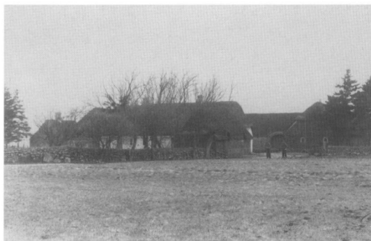
Vejgård ca. 1890.

Der er desværre ikke mange oplysninger om, hvordan bogen blev modtaget af herredets egne beboere. Noget kan dog tyde på, at den har fået en lidt blandet modtagelse. Således skulle præsten i Vorbasse direkte have advaret mod at læse den, fordi den indeholdt gamle