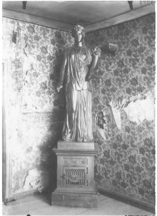
Fortuna fra Odense. Foto fra 1932 før Museet Møntergården modtog den.