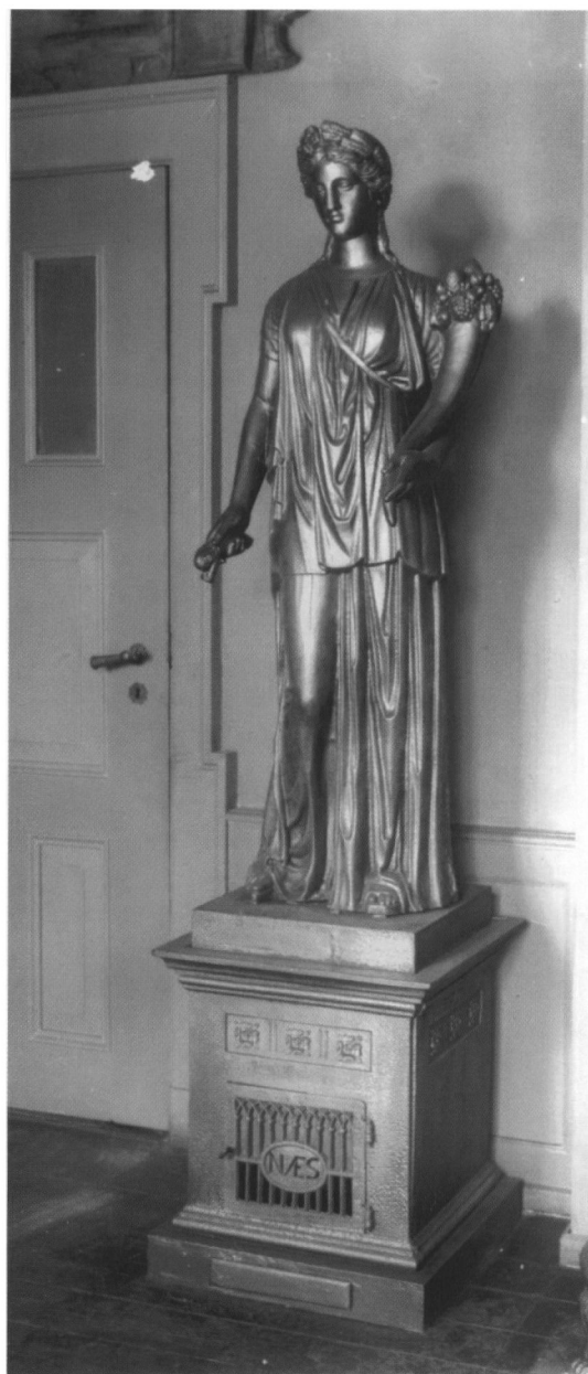
Fortuna på den Antikvariske Samling.

Kakkelovnen, der er fremstillet i støbejern, består af et firsidet postament, hvorpå der står en 148 cm høj klassisk kvindeskikkelse med et overflødheds-horn i venstre arm og kornaks i højre hånd. På hovedet sidder et diadem af kornaks. Ovnens fremtræder i dag helt sort. Enkelte steder er den sorte ovnsværte slidt af og det fremgår at skulpturens oprindelige overflade er bronzeret jern. Dermed har ovnen haft en helt anden fremtræden end i dag.