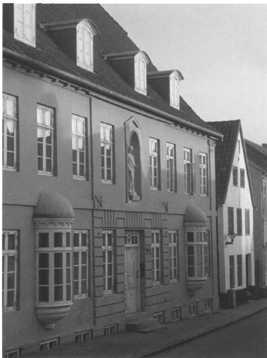
Fortuna fra Haderslev i Badstuegade 16.

Ovnen er første gang nævnt i litteraturen i 1932, hvor H.P. Hansen beskrev Den Antikvariske Samling, der på det tidspunkt havde til huse i sin egen bygning i sidefløjen til Ribe