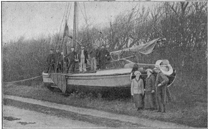
„Ane Marie“ fra Sønderho strandet ved Ribe Plantage under Stormfloden 1911.

Naar den Skade, denne Stormflod gjorde i Ribe, er opgjort til et adskilligt større Beløb end den ved