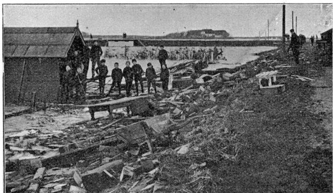
Damvejen i Ribe 4. Decbr. 1909. I Baggrunden Chausseen til Tønder.

Fra Sønderport havde man Lørdag den 4. December om Eftermiddagen, medens Solen mellem Bygerne kastede sit straalende Lys over Vandmasserne, en glimrende Udsigt over den vældige Vandflade mod Vest, hvor man saa Yderbjerrum langt ude og de to Indrebjerrumgaarde fuldstændig omflydt af Vandet. Adgangsveiene til Byen, saavel mod Nord som mod Syd,