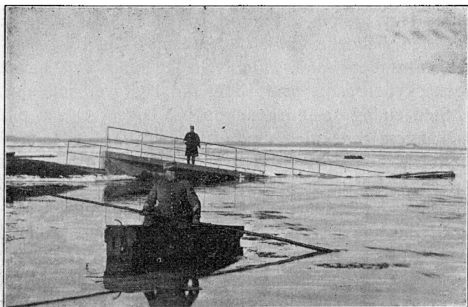
Stavnager Bro efter Stormfloden 1909.

Omtrent tre Fjerdingsvei øst for Ribe ligger Staunager Bro, som over Ribe Aa forbinder Seem Kommune med Obbekjær Kommune. Den blev bygget i 1907 som en Jernbetonbro med et Vandslug af 10. m., lig c. 32 Fod, eller c. 5 Fod mere end den c. 100 Alen