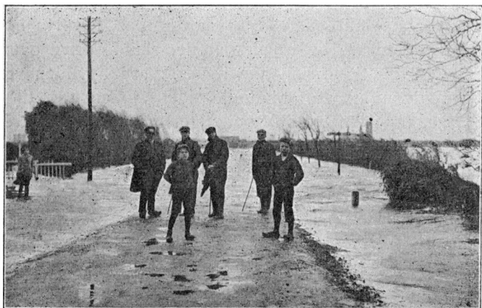
Ribe—Varde Landevei ved Indgangen til Plantagen under Stormfloden 1911.

rum Veien) sammen, og Stumperne deraf tilligemed det Lager af Tømmer, som det havde indeholdt, drev med vældig Kraft hen imod Broen. Denne truedes med Ødelæggelse; men heldigvis holdt den, omend Kørebanens vestlige Side ved det voldsomme Pres blev løftet adskilligt ud af sit Leie. Ved Sekstiden Mandag den 6. Novbr, om Eftermiddagen løiede Vinden stærkt af, og Vandet faldt da hurtigt.