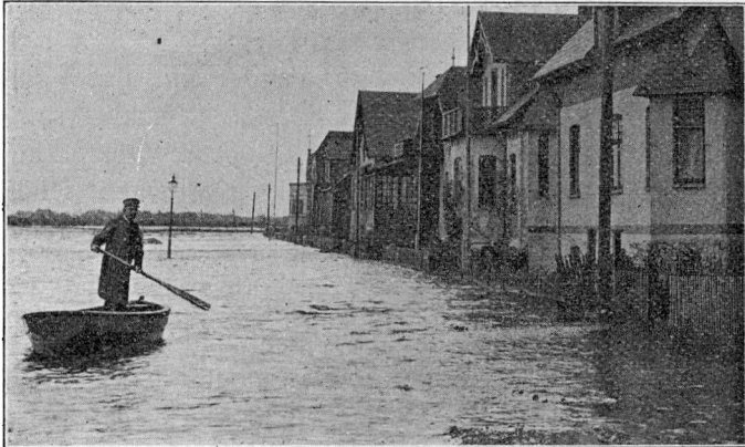
A. S. Vedelsgade paa Kurveholmen v. Ribe 4. Decbr. 1909.

I Ribe gik Vandet Fredag Aften Kl. 8 3 / 4 saa høit, at det spærrede Grønnegades Forlængelse og naede op i Korsbrødregade omtrent til den sydlige Gavl af Stiftsbogtrykkeriets Bygning (Mtr. Nr. 391), medens