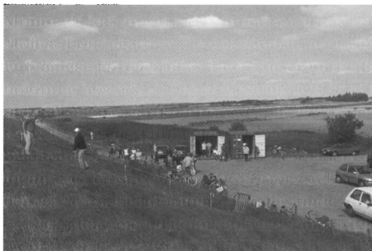
Den 11. september 2005 havde Darum Sognearkiv en velbesøgt udstilling om hav, dige og marsk i en container opstillet langs diget.

Den 11. september havde en initiativgruppe fra de tre vadehavssogne Vilslev, Darum og Tjæreborg arrangeret forskellige aktiviteter langs diget mellem Roborg og Kongeå Sluse. Der var mange kunstnere, der udstillede deres værker, jægere og fiskere fortalte om deres hobby, og ornitologer fortalte om fuglelivet ved diget. Darum Sognearkivs bidrag var en udstilling i en container, der var opstillet til formålet ved Darum Sønderby dige. Temaet for vores udstilling var »Hav, dige og marsk«, og den viste billeder og kort fra området gennem de seneste hundrede år. Udstillingen var velbesøgt, og billederne blev studeret med stor interesse.