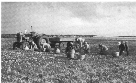
Kartoffelavlens har altid spillet en stor rolle på Grindstedegnen. Billedet viser, hvordan kartoffeloptagning foregik i 1950'erne.