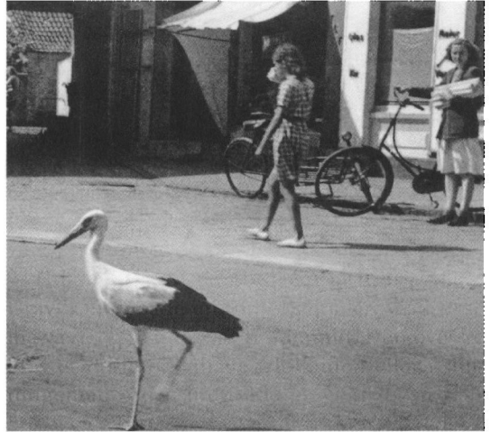
Fra Ribe Byhistoriske Arkivs billedsamling er fundet dette billede af en stork i Ribe omkring 1950. Foto: Ribe Byhistoriske Arkiv (B 2806)

Den anden udgivelse var RAL-projektet, De kom og de blev – indvandrere i Ribe Amt 1850-2005. Bogen blev præsenteret ved en fin reception i Grindsted først i december måned. Vort bidrag til bogen er en i Ribe bosiddende kvinde, der fortæller om opvæksten i Tyskland under Anden Verdenskrig.