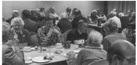
Den 1. november 2005 havde arkivet i Brørup en succesfuld mødeaften i Tirslund, som tiltrak mange og resulterede i nye medlemmer til arkivet.