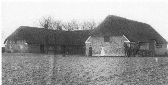
Gården i Tobøl som Hjerting Lokalarkiv besøgte for at tale med beboerne: To brødre som har boet der det meste af livet. Billedet er taget ca. 1930.

hos to brødre i Tobøl, den ene født i 1928 og den anden i 1932. Et af spørgsmålene til de to var, hvad de har lavet i deres voksenliv. De har begge været ude at tjene, men har ellers været på gården. I dag bor de fortsat på gården, som er særdeles flot vedligeholdt både inde og ude. Den ene sørger for maden og samler gerne til forråd af bær og kartofler fra egen have. Den anden passer alt det udvendige. De har ofte besøg af børnehave-børn, som får en tur med traktor og vogn. Ligeledes er der flere heste i stalden, som unge piger har opstaldet.