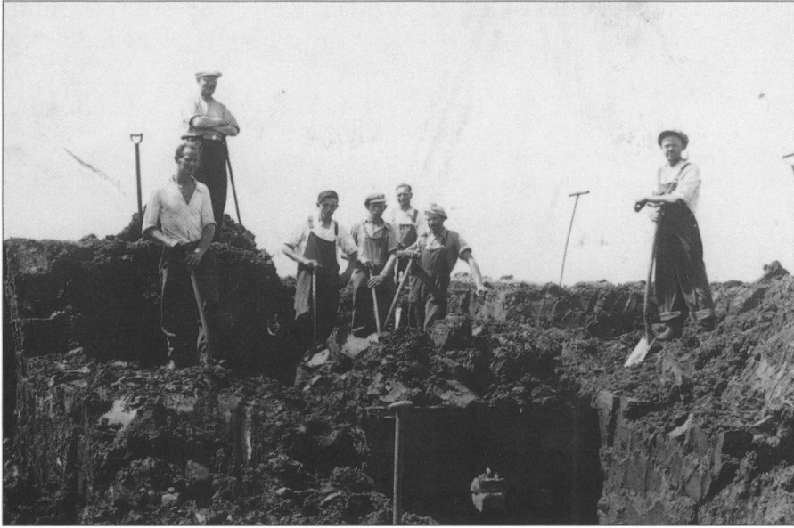
Tørvegravning i Bække Mose ca. 1942.