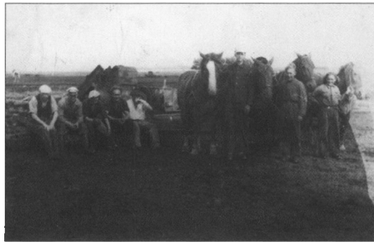
En lille pause i mosearbejdet i Bække Mose.

Efter at et sjak havde opgravet tørvedyndten, blev den på tipvogne trukket af en skinnetraktor kørt til ælteværket, hvor det blev tippet ned i æltemaskinen, hvor materialet blev findelt og opslemmet med vand. Der skulle en stor vandboring og en stærk pumpe med en stor vandbeholder til for at holde værket tilstrækkeligt forsynet. Derefter blev denne dyndvælling ført op i dyndkassen med en kopelevator. Den store kasse var af træ og stod forankret på solide træstolper. Af praktiske grunde skulle dyndet jo føres til vejrs, så dyndvognen kunne køre ind under, hvorefter der blev åbnet for lemme, og dyndet fossede ned i vognen, der var en stor trækasse sat på gummihjul. Det pjaskede til alle