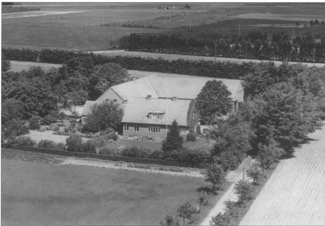
Den nye gård på Vittrupvej, der blev opført efter branden i 1938. I baggrunden ses en del af mosen. Foto omkring 1950, i privat eje.