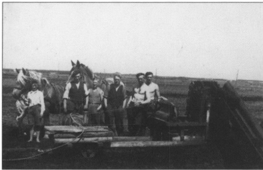
Æltemaskine til tørvefrembringelse. Bække Mose. Foto i privat eje.