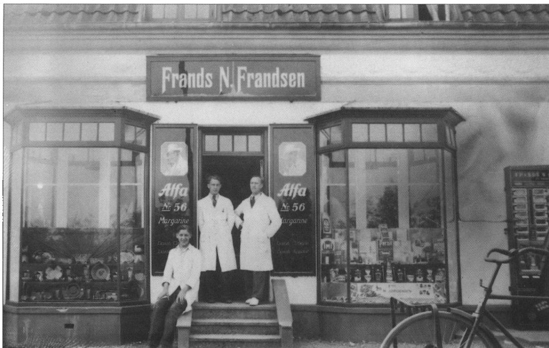
Købmand Frandsens butik i Tjæreborg. I døren ses købmanden til højre sammen med en kommis og en lærling.

Mens mor og hun snakkede om vind og vejr, gik mor rundt og så efter i køkkenskabe og spisekammer, hvad der manglede i husholdningen.