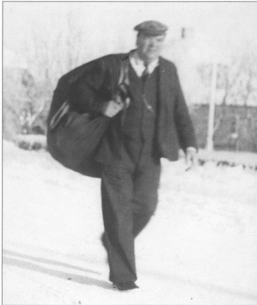
Uldkræmmer på besøg i Aastrup.

talte mor, at der havde været en kræmmer. »Han havde vist ikke rent mel i posen«, sagde hun til far. Jeg undrede mig, for han havde overhovedet ingen mel i posen!