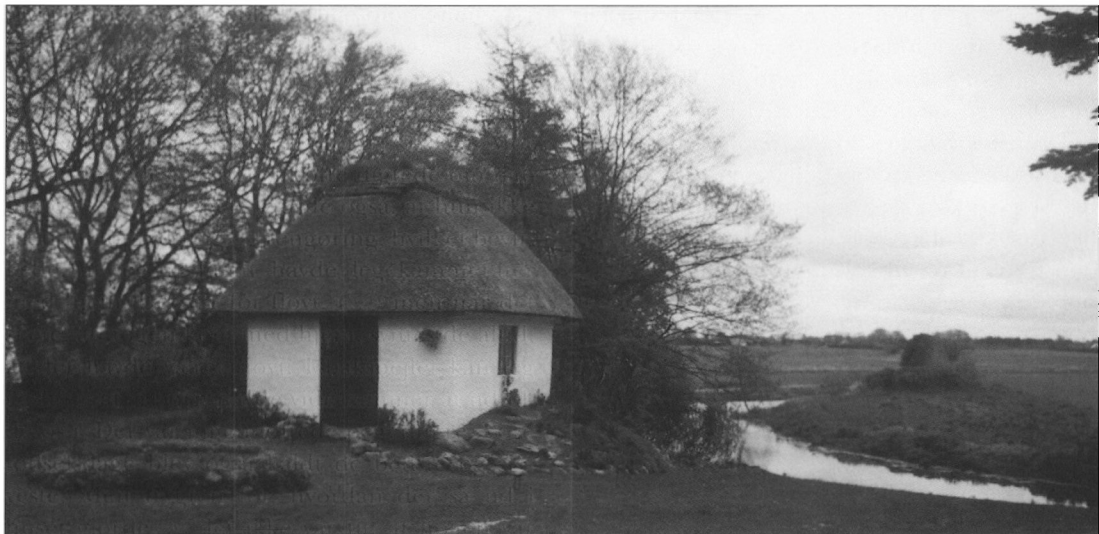
Ovnhuset, hvor bageovnen i gamle dage var installeret i haven til den fredede gård Nybro, Gl. Skolevej 40.