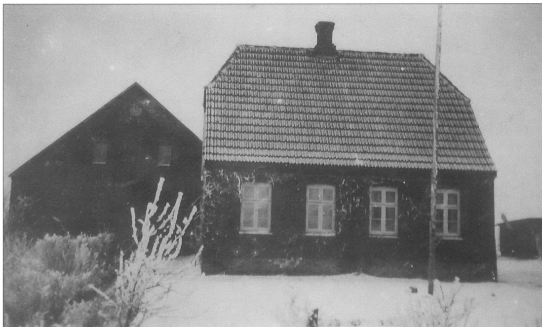
Husmandsstedet i Tanderup.