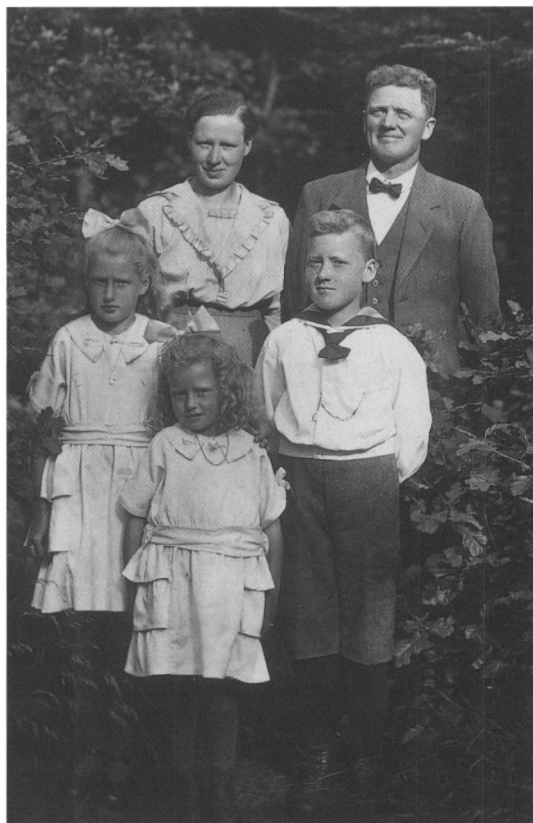
Familien på udflugt. Min moster og onkel har ligesom børnene »stadstøjet« på.

Efter 1946, hvor jeg rejste fra Sdr. Vissing til København for at studere, har jeg kun været i