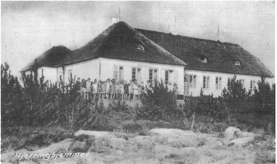
Hjertinghjemmet i sommeren 1932, hvor Københavns Kommunalærerindforening havde overtaget stedet til svagbørnskoloni.