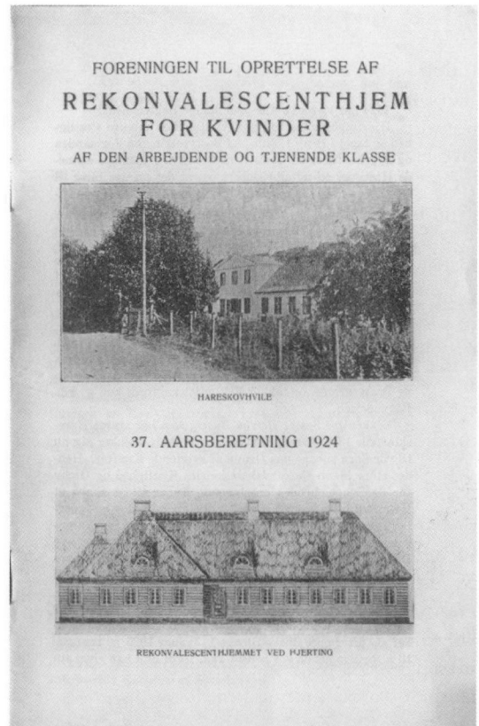
Præsentation af Hjertinghjemmet til foreningens medlemmer i 1924.