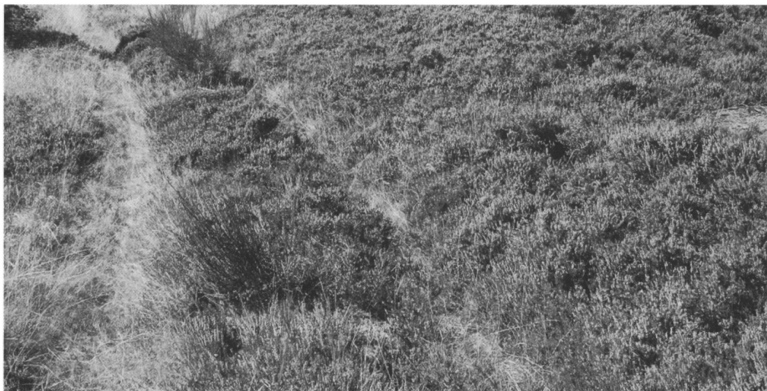
Spør af gammel vej over heden i Vester Aastrup i Aastrup Sogn.

løb) eller en konstruktion der sikrer en vej i vanskeligt terræn. Ligesom vej findes dette sammensat til former som bulbro 'plankebro', fjællebro 'bræddebro', spangebro 'plankebro', stenbro 'bro konstrueret af sten' eller evt. 'stenbelægning på vej', stokkebro 'bro konstrueret af stokke'. Ord som stenbro og stokkebro betegner ikke nødvendigvis broer over vandløb, men kan ligeså vel betegne en sten- eller stokkebelagt strækning igennem blødt terræn. I et marknavn som fx Stenbro Tægt (MK 1785 Steenbroe Tægt) på Sig bys jorder (Sig s., Øster Horne h.), med agerens beliggenhed væk fra vandløb, kan betydningen meget vel være 'stenbelagt vej' i stedet for 'stenbygget bro', så man må være på vagt overfor sammensætninger på -bro der har paralleller i det almene ordstof. Ellers forekommer bro både som første led og som sidste led meget tidligt i stednavne i Ribe amt, som fx det nu for-