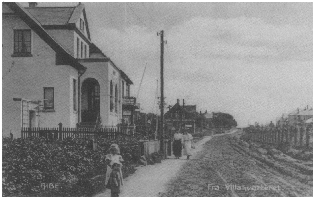
Som Tangevejens begyndelse tog sig ud omkring 1910. Foto: Ribe Byhistoriske Arkiv. B 4163.

Efter at der i 1916 var vedtaget andre styrelsesformer inden for postvæsenet, fik han udstedt en ny kontrakt. I denne var kravet om kautionsstilling bortfaldet, og postbudet ansættelse på en bestemt rute blev erstattet af tilknytning til et bestemt posthus. Altså et skridt hen mod et fastere ansættelsesforhold ved etaten.