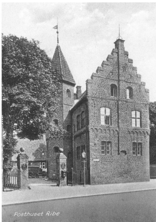
Ribe Postkontor, som fra 1886 til 1969 lå i Puggaardsgade i den gamle bispegård, Tårnborg.