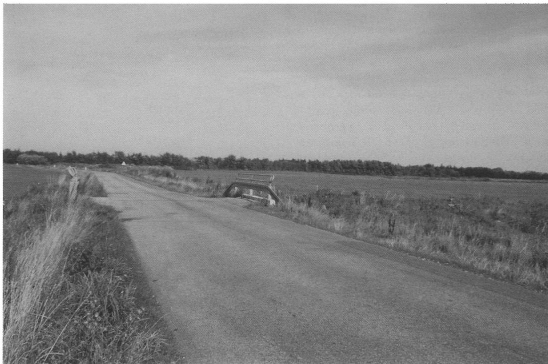
De nye tider. Vasvej med broen over Obbekærkanalen 2004.

mand, for hvem det var en æressag at være pligttro til det yderste og en mand, der ikke var bange for at give sig selv i sit arbejde.