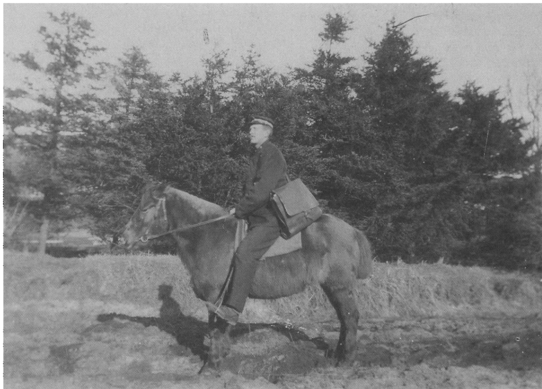
Se indledningsafsnittet.

de i 1886 ind i bagbygningen ved Taarnborg, den gamle bispegård i Puggaardsgade. 1 Bagbygningen havde i bispetiden tjent som hestestald. I hovedbygningen blev der i 1888 indrettet residens for postmesteren. Endelig erhvervede postvæsnet i 1902 Taarnborg med hovedbygning, bagbygning og sidebygning, og postmesteren kunne da flytte ind i hele hovedbygningen. Først senere indrettedes postkontor i hovedbygningens stueetage, dog således at budstuen mv. forblev i bagbygningen. Sådan var tilstanden indtil 1969, hvor man indviede