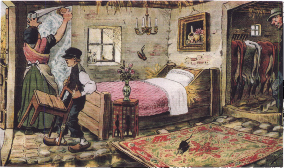
Blæksprutten 1905: Tyndekommissionen ventes! Sælges i dag som postkort på Aakjærs gård, Jenle.

dets kontraktforhold. Og der tænkes nok ikke på nedskrevne kontrakter, men mundtlige aftaler, hvor husbonden eventuelt betalte fæstepenge som besegling af aftalen.