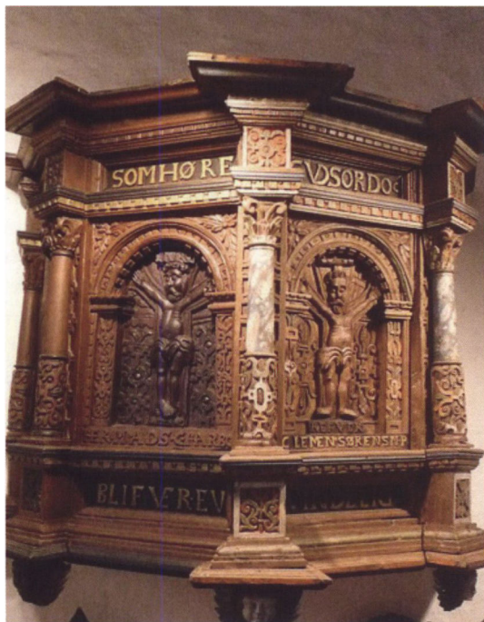
Prædikestolen, som Bendix Norby bekostede i 1626.