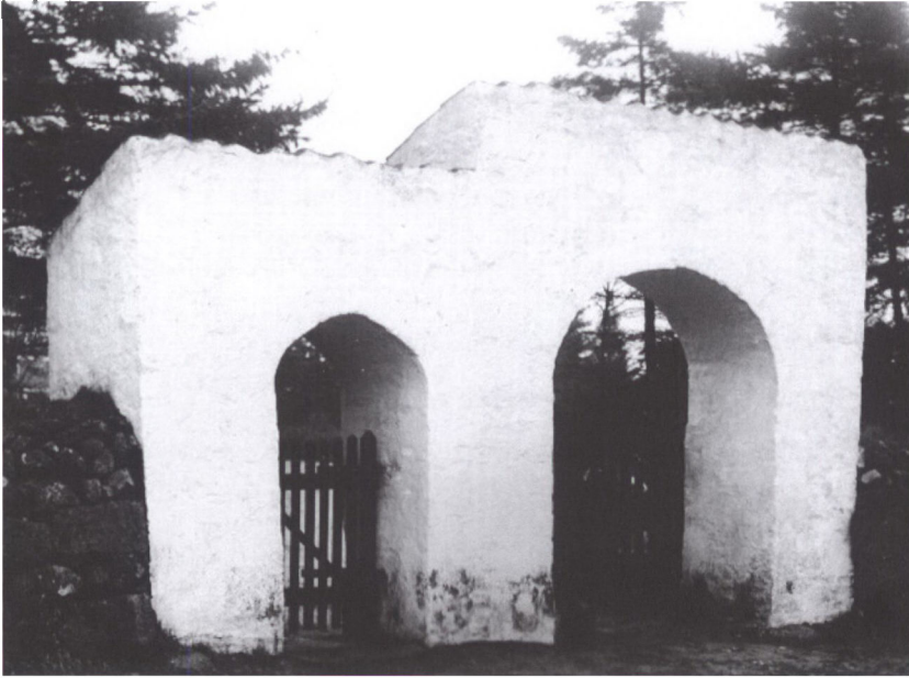
Grindsted Kirkes senmiddelalderlige indgangsportal.