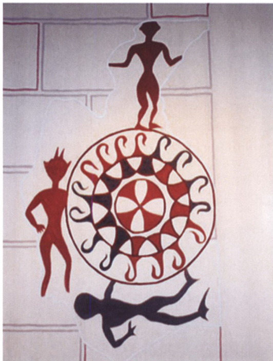
Livets hjul – afbildning af kalkmaleri fra Grindsted gamle kirke i Den kirkehistoriske Samling i Grindsted Kirkes tårn.

det var nødvendigt.« Derfor spotter man Gud ved at tænde lys, medmindre de har en ganske særlig betydning. Det har de to alterlys da også: »Det første lys på alteret brænder til hæder og ære for Jesu Kristi legeme, og det andet lys brænder til hæder og ære for hans velsignede blod, og især for at vore hjerter kan blive oplyste, så vi kan få en sand kundskab om vore synders forladelse, lige så tit vi går op for at lade os berette.« 31