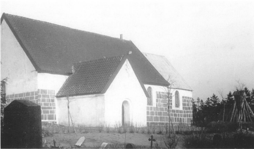
Grindsted Kirke 1916 – i det ydre meget lig kirken 300 år tidligere.

sten til det næste års besøg og kunne altså have varierende længde.