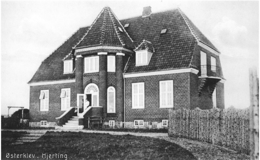
Østerklev . Hjerding .

Østerklev. Mødrehjælpens svangrehjem, som det fremstod ved købet i 1947. (EBA 03088-194).