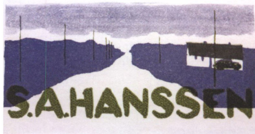
Hanssens Ex Libris.

men for de fleste – tror jeg – at nyttige gaver er mere kærkommen.« Samtidigt oplyste han, at enkerne fik et gavekort på 25 kr. til en slagter, og til hvert barn blev der givet et gavekort på 35 kr. til beklædning. 12 år senere i 1966 spurgte Hanssen, hvor længe Frihedsfonden skulle bestå, og hertil svarende man centralt fra – lidt endnu, dog ikke længere end til 1970.