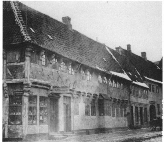
Ballins ejendom i Ribe. Foto ca. 1880.

Slægten Ballin er overordentligt vidt spredt i verden, så slægtskabet bliver i de yderste