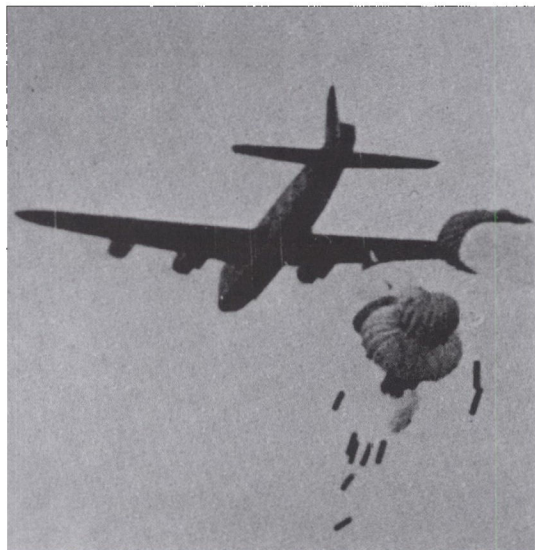
Nedkastning af forsyninger (Jespersen, bind II s. 219).

Fra engelsk side blev denne nedkastning benævnt Tablejam 10, og det var den eneste