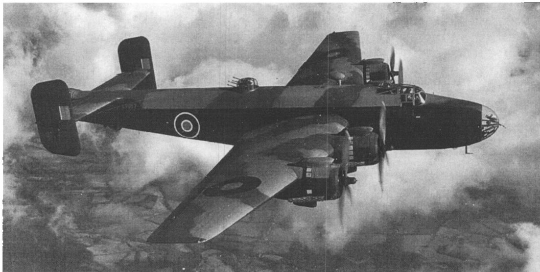
Handley Page Halifax.