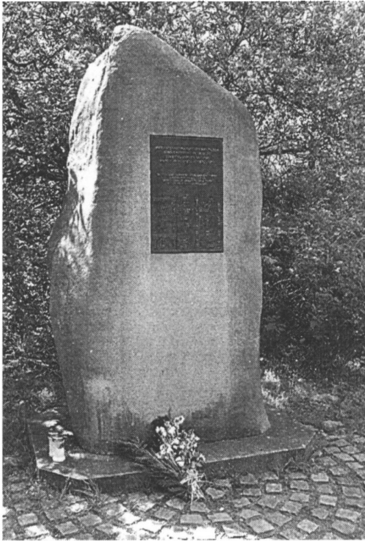
Mindestenen i Rebild Bakker ( www.airmen.dk ).

Gade, Sven Ove: Toldstrup. En biografi om en modstandshelt. Gyldendal 2011