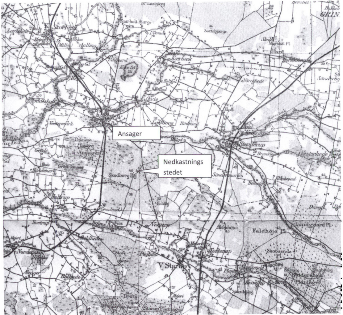
Nedkastningspladsen Skodborg Høj (Generalstabskort over Danmark 1:100.000).

besætningen skulle finde positionen 55^{\circ} 40' 41'' nord og 08^{\circ} 46' 42'' øst beliggende 17\frac{1}{2} km sydsydøst for Ølgod og 13 km sydvest for Grindsted.