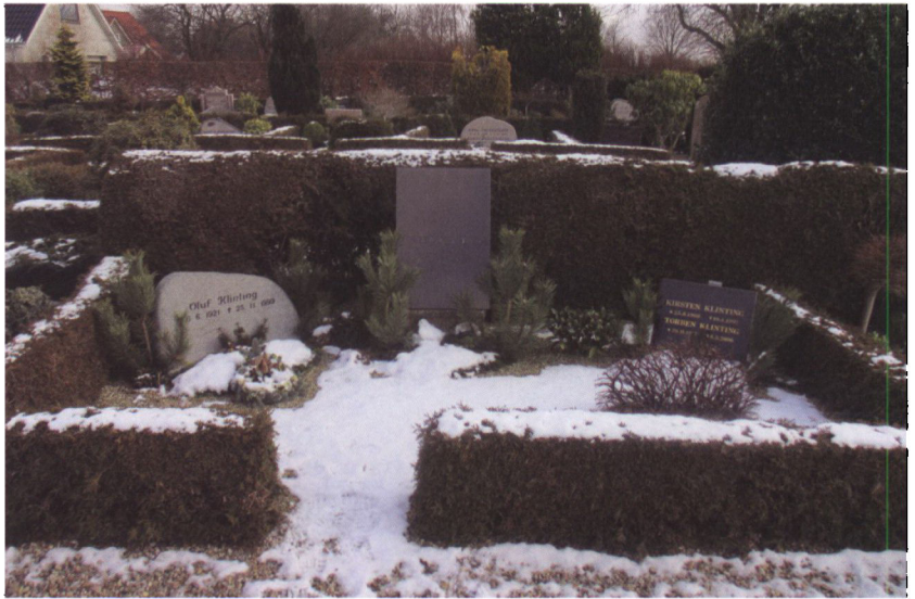
Familiegravstedet på Fåborg kirkegård.

det i de fleste tilfælde var konen og børnene, som fortjente præmien. Som den første lærer i landet fik han lån til opdyrkning af hede og mose.