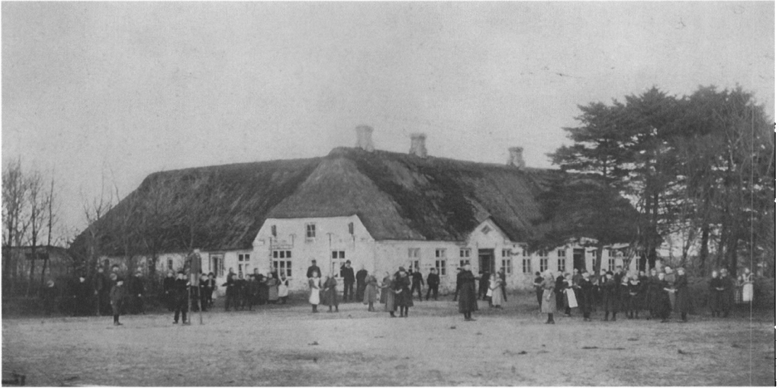
Slepsager Skole i Fåborg Sogn.

1882. Han havde fået indtryk af, at Fåborg var mere end et fattigt hedesogn. Det var et sogn i opkomst, og der var gode fremtidsmuligheder. Jorderne var slet ikke så fattige, men folk forstod blot ikke at dyrke dem.