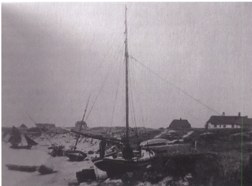
Standen ved Nymindegab. Maleri af Laurits Tuxen. Tilhører Nymindegab Museum.