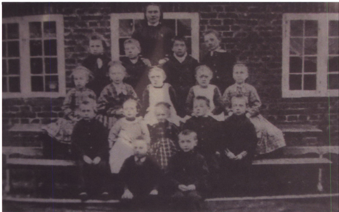
Skolebillede fra Kirkeby i Henne Sogn.