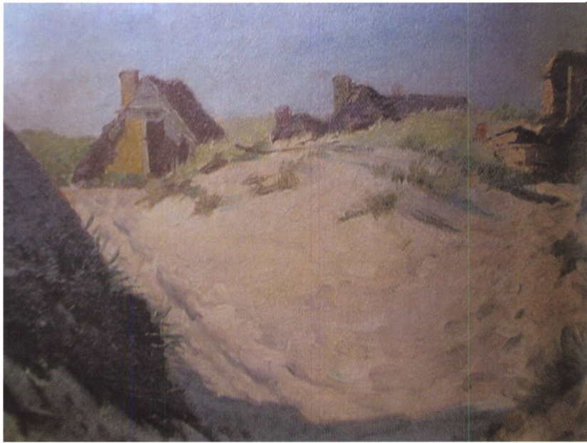
Maleri af Laurits Tuxen. Tilhører museet i Nymindegab.