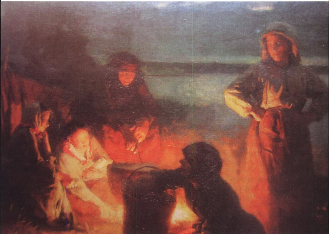
Maleri af Lauritz Tuxen i Nymindegab Museum. Trankogning på stranden.