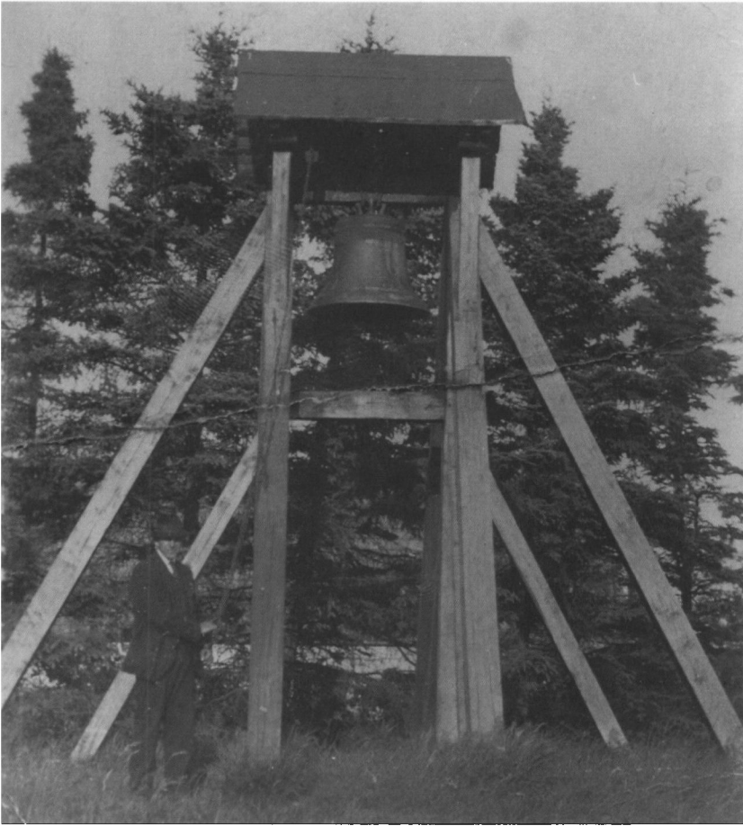
Klokkestabel med kirkevæрге Jens Præstegaard 1921.

Herefter blev kappen meget omhyggeligt løftet af, den falske klokke slået itu og fjernet, kappen med stor nøjagtighed sænket ned på plads igen, og kernens indre og støbegruben blev fyldt op med hårdtstampet jord, så kerne og kappe kunne modstå metaltrykket under støbningen.