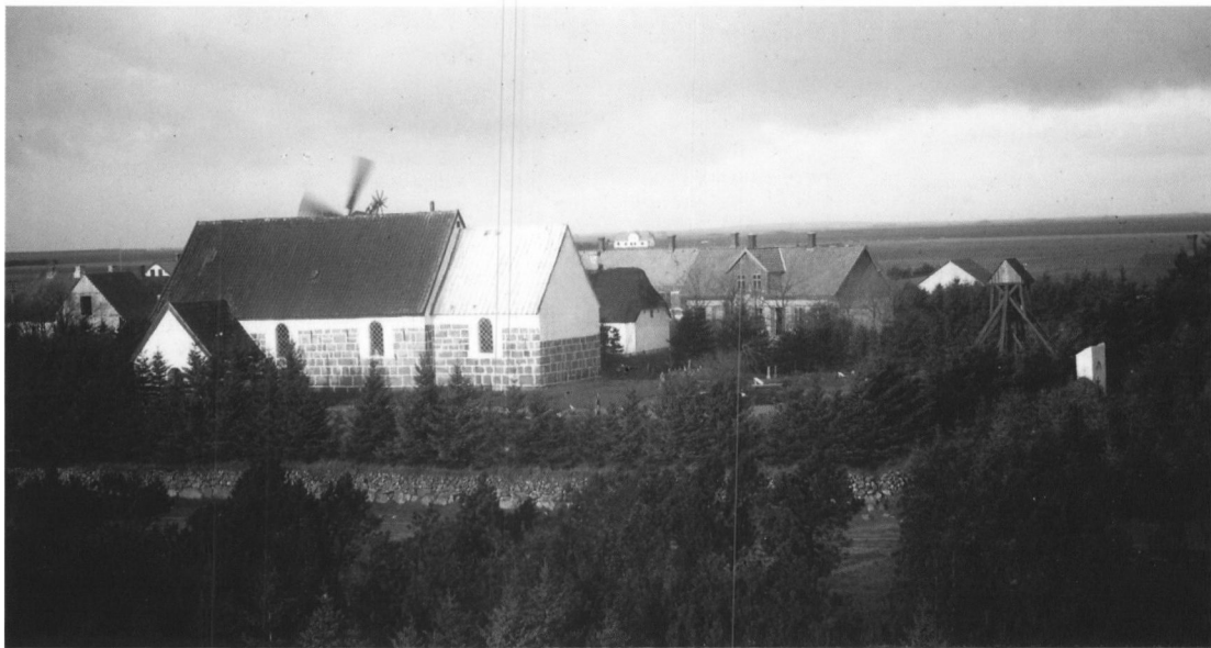
Grindsted Kirke med klokkestabel 1907.

tid siddende sognepræst, der har villet demonstrere sin lærdom, når han valgte bibelverset eller forfattede indskriften. Derfor også sammenblandingen af tysk, som var støberens sprog, og latin, som var præstens fagsprog, på Grindsted Kirkes klokke. 4 Sognebørnene har ikke kunne forstå hverken det ene eller det andet af de to sprog. Først på klokker støbt fra omkring år 1800 forsvinder de latinske indskrifter helt.