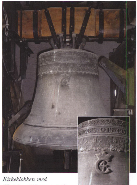
Kirkeklokken med Christian IV's navnetræk.