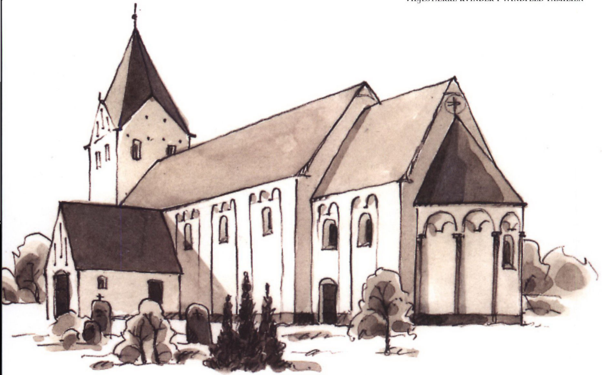
Farup Kirke. Tegning: Inger Tobiasen.

nyde Huuset og ovenbemeldte Grund til frie beboelse og brug, men efter Hans Moeders Død, Nyder hand til Køer ingen græsning eller foeder.»