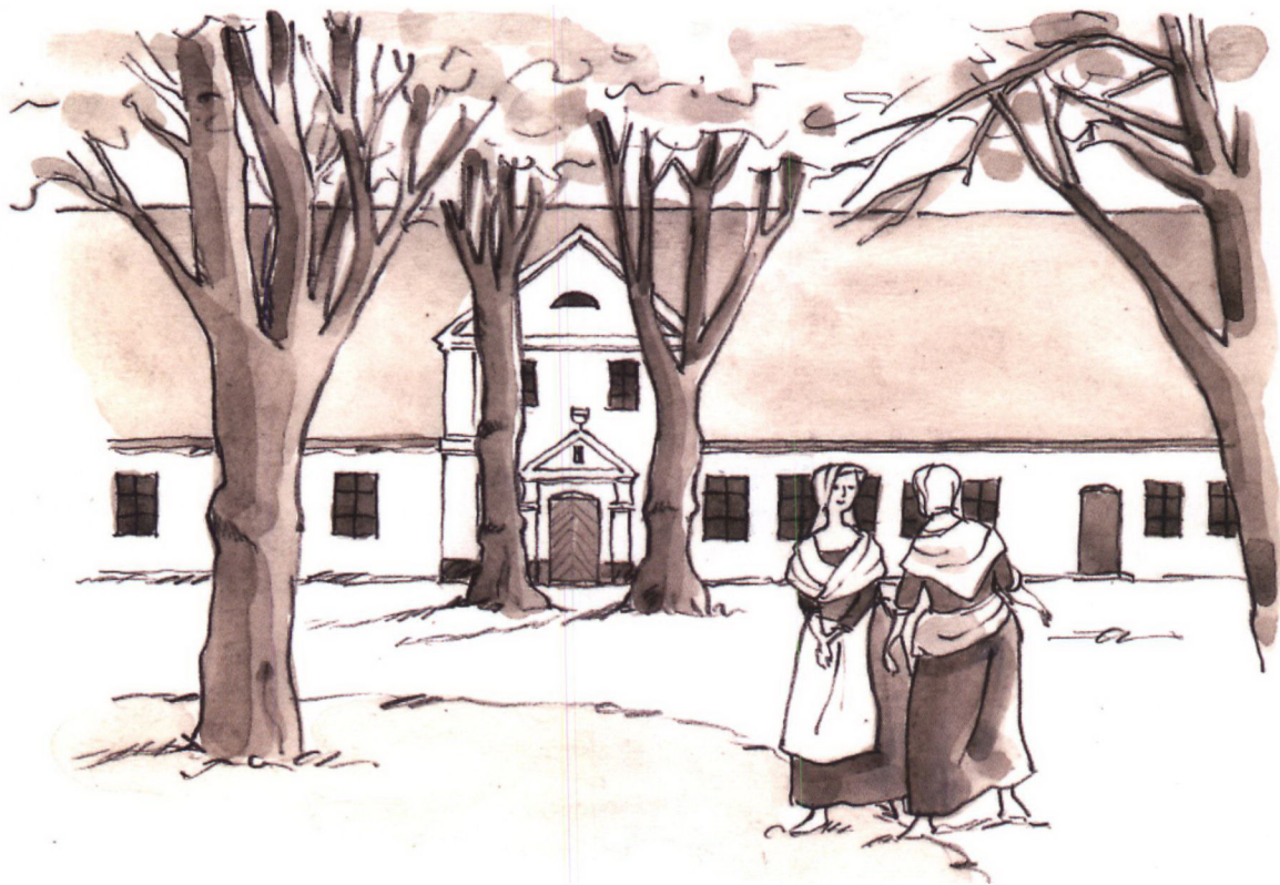
Gårdspladsen på Hesselmed Gods, hvor både anden og tredje generation af familien var fæstere.