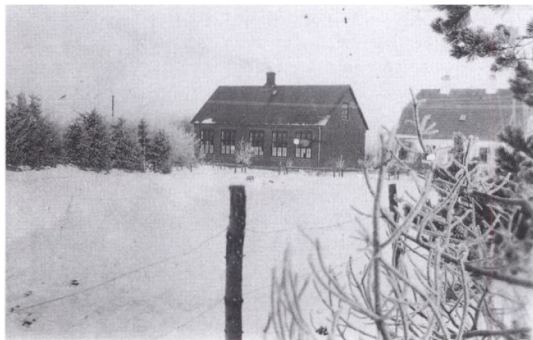
Tvilho skole ca. 1920'erne.

I vores arbejde på arkivet har vi 2008 valgt at prioritere et projekt med at lave en DVD om Glejbjerg. Vi er så heldige, at en Glejbjergborger har optaget en smallfilm af forskellige begivenheder i Glejbjerg i 1959. Den blev så senere overspillet til et videobånd, som kunne købes på arkivet. Der var dog ingen tale på filmen, og vi har derfor ønsket at modernisere filmen ved at lægge tale på, som fortæller om begivenhederne og få den over på en DVD. Den er næsten færdig og skal med på særudstillingen på Sønderkov den 29. maj 2009. Derudover vil den kunne købes på arkivet.