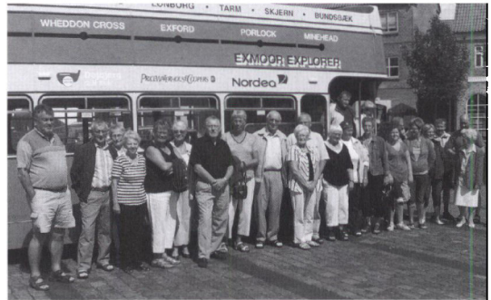
Deltagere i turen "Mæ æ ruttebil te Waaer" fotograferet på Torvet i Varde.

Noget der direkte har påvirket arkivet, har været kommunalreformen. I løbet af 2008 er der gjort et stort stykke arbejde for at få de 18 arkiver, som vi nu er i Varde