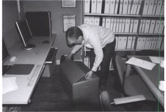
Nedpakning af arkivalier inden flytning til arkivets nye lokaler.

Året bød også på bryderier i form af regulære fugt- og indeklima-problemer i vores kælderlokale, og tanken om et nyt tilholdssted begyndte at spire – men det er jo ikke så let en sag! Og dog – pludselig viste der sig sidst på året en løsning, som måske kunne realiseres. Resultatet er blevet, at arkivet pr. 1. april 2009 flytter til ledige lokaler