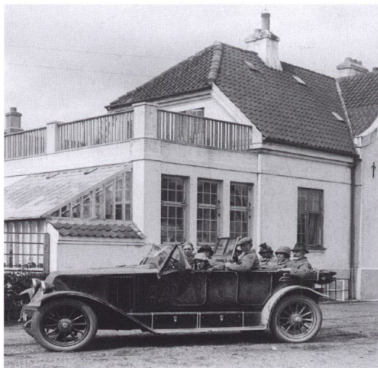
På vej til Rask Hovedgård i Ella Melbys bil. Stedet er Kirkegade i Grindsted med apoteket i baggrunden. På bagsædet længst til højre i billedet ses apotekereren.

den 1. August 1923.