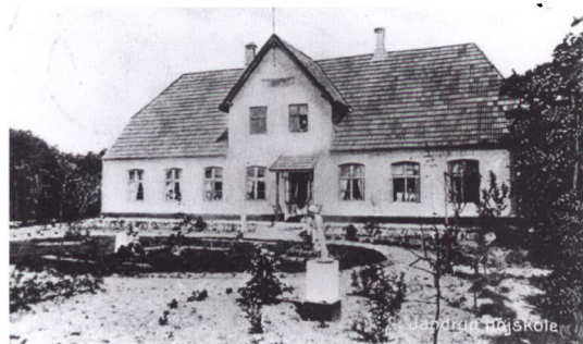
Janderup Højskole, 1911.

Vi vil igen i år takke Skads m.fl. Herreders Brandkasse for donation, og alle der har vist interesse for arkivet. Husk vi er sognets hukommelse.