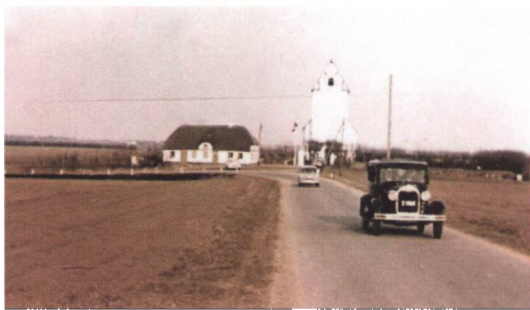
Forden på vej fra Sneum Kirke på forfatterens bryllupsdag.

blive ødelagte. Hvor sørgeligt at se den stå der, efterhånden med et tykt lag støv overalt, selv om der var lagt en presenning over det meste af bilen.