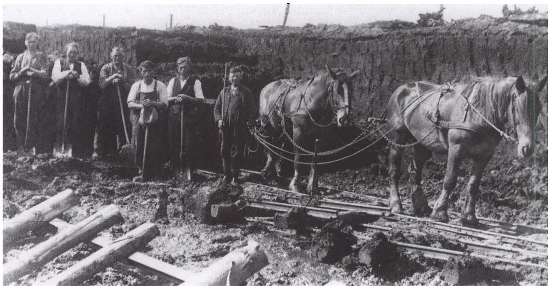
I tørvegravnen hos Legarth, Bække Mose i 1940'erne.

Under Anden Verdenskrig måtte man ty til brug af dette brændsel igen. Dels var der arbejdsstyrker til rådighed, som kunne påtage sig besværet, dels var der motorisering nok til at man kunne forbedre kørevejene, og endelig kunne man forarbejde tørvene ved maskinel hjælp. Mange danske moser blev tømt for tørv i krigsårene, og mange steder gav tørvegravningen