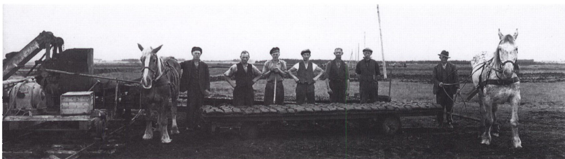
Tørvepresse i Bække Mose 1944.

samme havde hesteejerne. Det var udregnet som en fast pris for hver tusinde stykker tørv. Den omtalte presse kunne producere 40.000 stk. pr. dag. Hvad lønnen var pr. tusinde, ved jeg ikke.