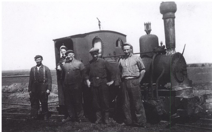
Bække Mose sommere 1944.

anledning til Klondykelignende forhold, hvor arbejdere under usle boligforhold måtte slide i det, mens vognmænd og entreprenører havde gyldne dage.