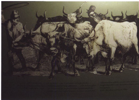
Tegning af stude og studedriver. De var ikke var så store og fede, som man i dag forestiller sig. Fra udstillingen på Roter Haubarg.

port i Ribe dagen efter hændelsen, så det var kendt, før kommissionen blev nedsat.