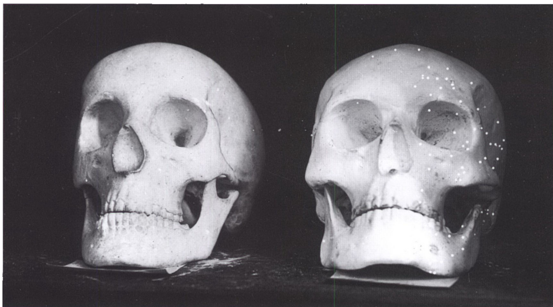
Dronning Bengerd's kranium til højre. Til venstre Dronning Sofies kranium. Dronning Sofie var Valdemar Sejrs mor, død 1198.

sandsynligste bryllupsby på grund af, at byen ligger bedst for landing med skibe, der er afsejlede fra Scheldefloden, og fordi kong Valdemar tidligere var blevet viet i Ribe og endelig fordi kong Valdemars og dronning Dagnars ældste søn, Valdemar (den »Tredje«) (1209-1231) siden hen blev viet i denne by, til Eleonora (ca. 1211-1231) yderligere en portugisisk prinsesse. Men ingen aner i virkeligheden, hvor brylluppet fandt sted.