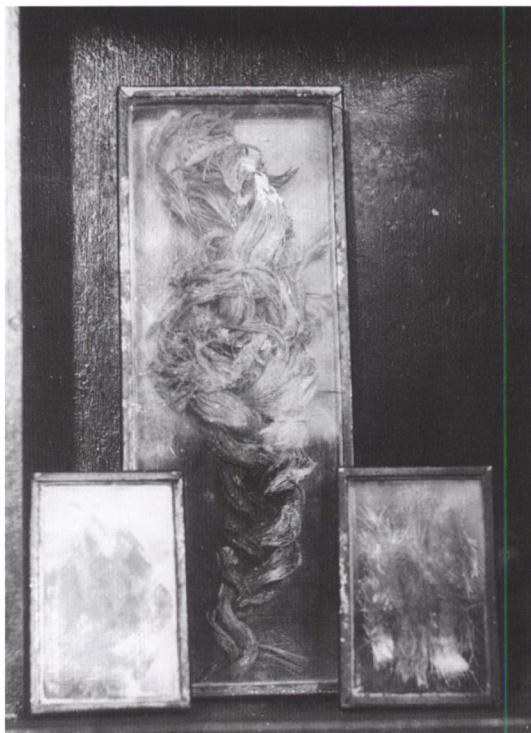
Dronning Bengerds fletning i Ringsted, St. Bendts Kirke.

Vi er altså afskåret fra at vide noget som helst om