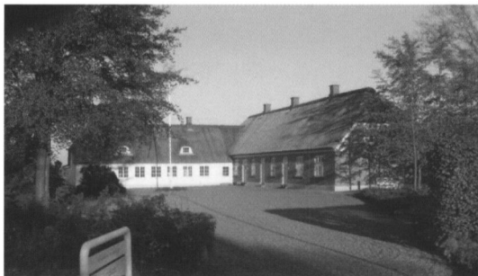
Bryndum skole nedlagdes 1960 og rummer dag både bolig og virksomhed. Skolen er fornemt restaureret og blev 2006 præmieret af Esbjerg Kommunes Byfond for smuk renovering af hus og miljø.