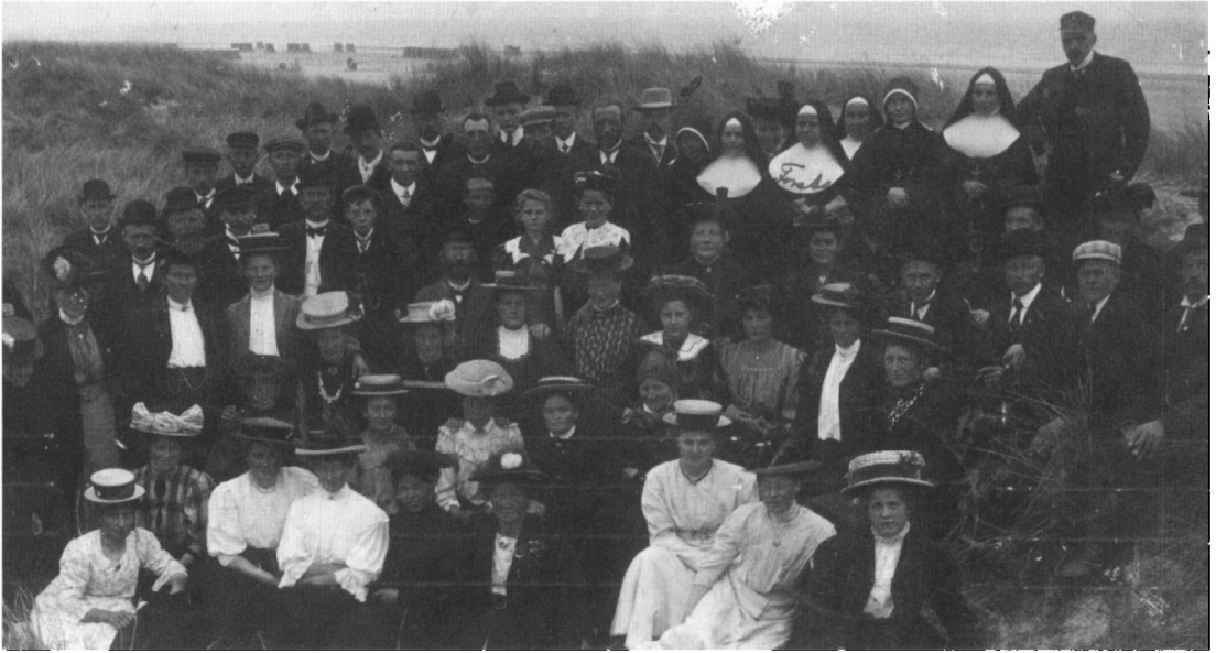
»Hele sanatoriet i Fanøs Klitter 26/6-09«. Henved 55 patienter, seks søstre og overlæge Brinch ses på fotoet. Alle er i deres stiveste puds. Lokale gårdmænd i Gjesing stillede hestevogne til rådighed og formodentlig har også lokale folk på Fanø gjort tilsvarende. Kortet er sendt til skibstømrer D. Petersen den 27.07.09 og underskrevet D.D.

stillede. Det er disse postkort, denne artikel handler om.