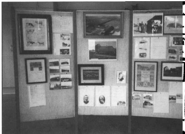
Udstillingen på Hostrup Sognearkiv i anledningen af Myrthuedagen 2004.

Mølhøjvej 10, Andrup, 6705 Esbjerg Ø Åbningstid: Mandag kl. 14.00-16.30 samt efter aftale med lederen