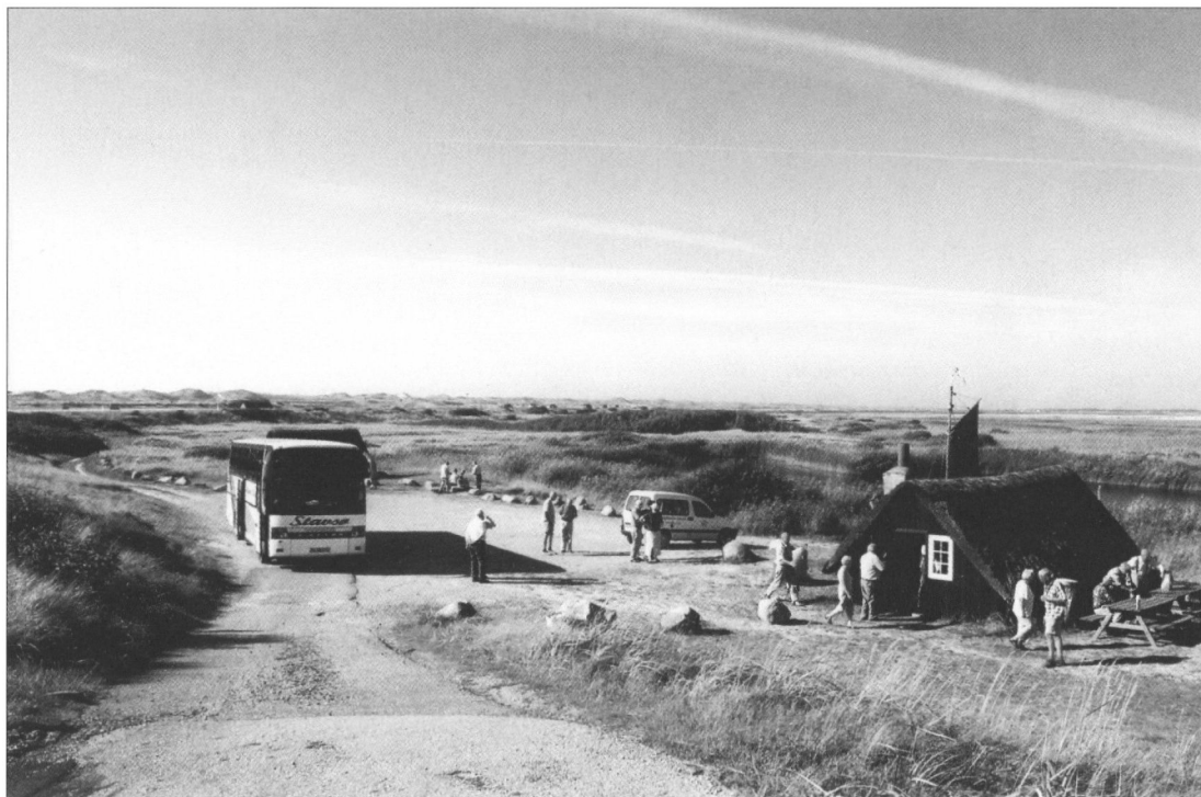
Efterårsmødet, lørdag den 4. september 2004. Sidste stop ved Esehytterne i bunden af Ringkøbing Fjord ved Nymindegab.