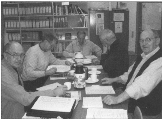
Bestyrelsen for Hejnsvig Sognearkiv i koncentreret arbejde.

Hejnsvig Lokalhistoriske Forenings bestyrelse arbejder aktivt på arkivet. Foruden hver onsdag formiddag at hjælpe med ajourføringer af de indkomne arkivalier, er der i året nedsat et gårdhistorisk udvalg. Formålet er at invitere til møder på arkivet, hvor forskellige personer fortæller om hvorledes hverdagen på ejendommene foregik, i den tid han eller hun kan huske – det er tanken, at så mange emner som muligt vedrørende alle ejendomme i vores område skal registreres. Samtidig har vi et godt hjemmehold, der kan hjælpe med at udfylde de manglende navne, adresser datoer m.v. som vi selvfølgelig har stor behov for.