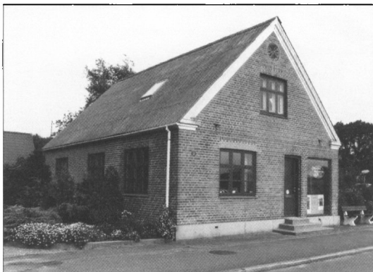
Facaden, Blåvandshuk Lokalhistoriske Arkiv, Kirkegade 3, Oksbøl.

Årets indkomster har været præget af afleveringer fra de forskellige menighedsråd, der har ryddet op i deres samlinger og har fået de retmæssige arkivalier afleveret til landsarkivet.