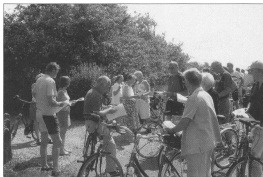
Fra cykelturen rundt i Årre Sogn, august 2004.