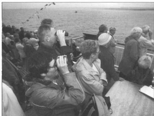
140 personer var med motorbåden »Sønnerho« på sejltur i Ho Bugt, hvor der bl.a. blev kigget på sæler.