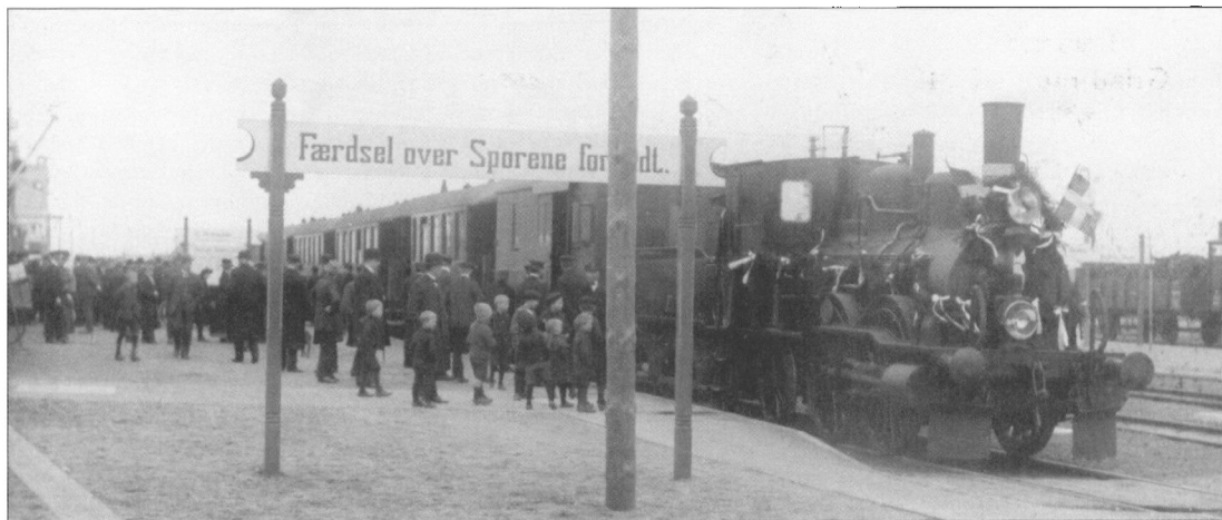
Det første tog fra Varde er ankommet til jernbanestationen i Grindsted. Billedet er taget den 12. april 1919 af ukendt fotograf.

Hvad angår fremtiden, så ved vi jo nu, at der vil ske ændringer. Kommunesammenlægningen vil betyde, at der bliver flere arkiver, som skal forsøge at synliggøre sig