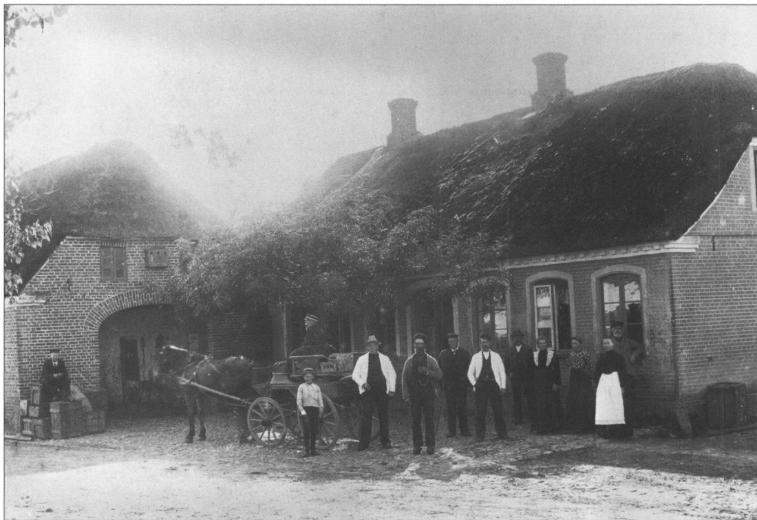
Aastrup Kro efter en ombygning efter at Iver Iversen havde overtaget den i 1904. Yderst til venstre en bagervogn fra Holsted. Midt i billedet med den hvide jakke ses kreaturhandleren, der benyttede rejsestalden som auktionshus. Foto ca. 1906 i Aastrup Sognearkiv nr. 1351

Et resultat af dette var, at der i 1907 gennemførtes de første kommunale afstemninger om, hvorvidt der skulle gives bevillinger til kroer og hoteller til udskænkning af spiritus.