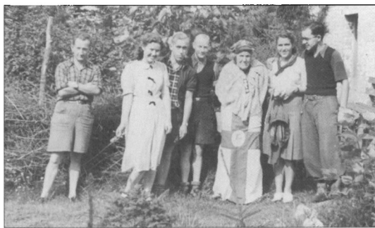
I sommeren 1942 gjorde Esbjerg-vandrerne bl.a. stop ved Siska i Darum. Hun står som nr. tre fra højre.

På Solfang mødte vi medlemmer af Dansk Vandrelaug fra andre byer, bl.a. Tarm og