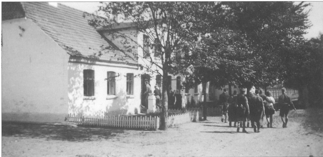
Medlemmer fra Dansk Vandrelaug fotografæret foran Vorbasse Vandrehjem i 1940. Det lå på Østergaard og var et af de foretrukne steder at komme.

begrænsninger, der var på den private bilkørsel. Nogle af os Esbjerg-folk har bl.a. boet i ét af hendes sommerhuse.