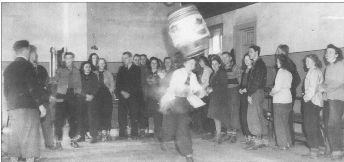
Fastelavnsfest i Tarp Kro i 1944.

Vi kom til den yndigste lille bæk, som frosten i søvn havde lullet, mon alle fra springet kom tørskoet væk? Nej, Agnes krøb op af hullet. I Tjæreborg Kro stod kaffen og vented' på os på sin vante plads i dåsen på hylden, nu var det os, der vented' på den en time til ende, hvem havde skylden? Men ventetiden er aldrig lang, når vandrere venter, – vi tog os en sang. Den ene sang blev til fler', og mange vi sang af de kendte sange. Nå, der kom da kaffen á lá Fuglsang – cikorie, og Jan lived' op og kom med en historie. – Tiden løb hurtigt, som altid i livligt selskab den går, vor turleder førte os an til den sidste tur – til Tjæreborg Statsbanegård. Vi derfra billetten til Esbjerg tog – I kan vel gætte, Ej mere der er om vor tur at berette. - d.