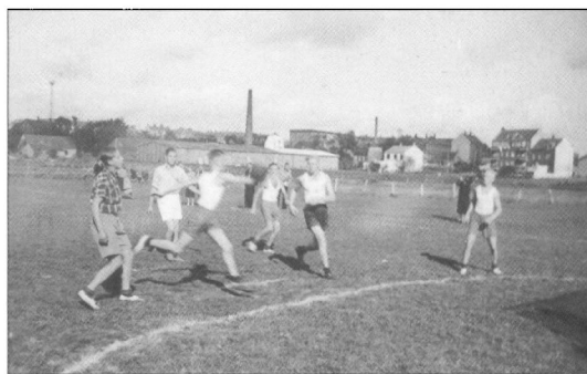
Håndbold indgik også i Dansk Vandrelaug's aktiviteter. Man spillede på Østre Skoles bane i Klatterup, i hvert fald i sommeren 1940, hvor billedet er fra.