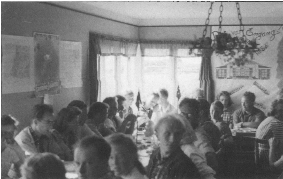
Der var trangt, når medlemmerne samledes inde i Friheden som her til min fødselsdagsfest i 1943.