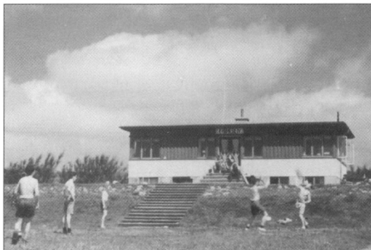
Friheden i Hjerding, som Silla brugte fra sommeren 1942, efter Solfang i Henne var taget i brug til andet formål. Huset er revet ned i dag.