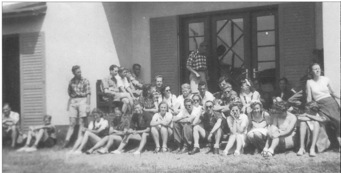
Der slikkes solskin foran Solfang i Henne i sommeren 1940.