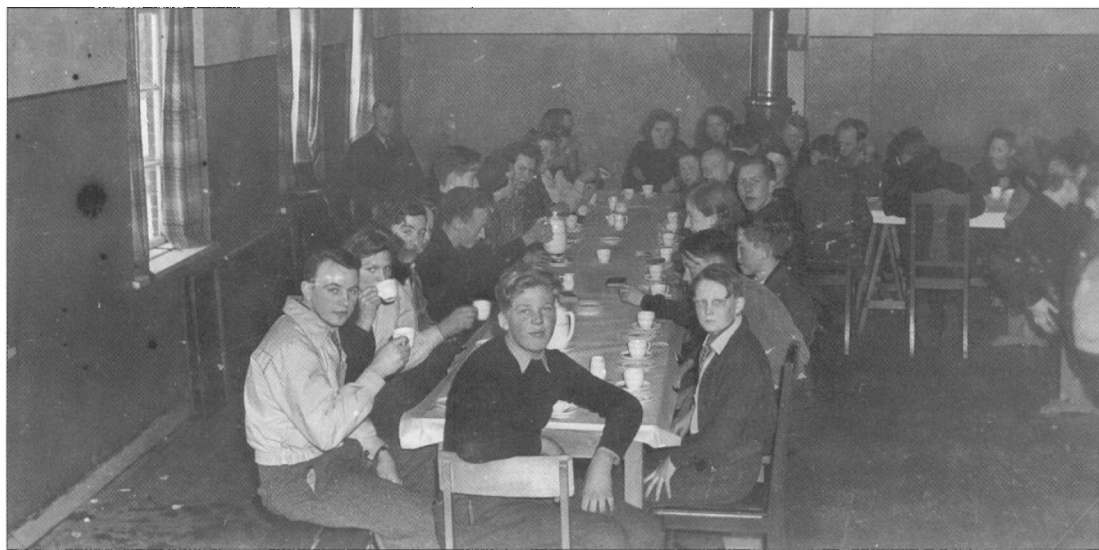
54 medlemmer deltog i Vandrelaugs fastelavnsfest i Tarp Kro i 1942.

Efter det stiftende møde kunne man begynde at sætte forskellige aktiviteter i gang. Dansk Vandrelaug lignede måske en forening, men opbygningen var en anden. Man havde ikke en formand, men arbejdede i en række udvalg. Man holdt laugsmøder og talte om laugsmed-