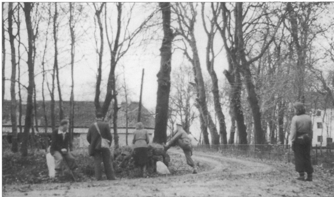
Et stop i Brørup Sønderskov i forbindelse med en af vandreturene til Aatte Bjerge. Denne tur blev afholdt den 10. november 1943.

af besættelsestidens oplodsede privatbiler var kroerne tomme om søndagen, så kromanden bød altid besøgende velkommen med deres medbragte madpakke, bare de købte en sodavand eller en kop erstatningskaffe. Ofte sørgede kroværterne for, at radioen blev tændt, så vi kunne høre Osvald Helmuth, som nylig havde fået sit gennembrud, synge nogle af sine populære viser, eller vi kunne nyde Hyp lille Lotte, som var en af tidens populære sange. Som tak for den gode behandling leverede vi til værtens store fornøjelse en vandresang eller to, inden vi ad nye veje fortsatte til Holsted Station for at tage toget tilbage til Esbjerg. Som regel var vi hjemme sidst på eftermiddagen med 20 km vandretur bag os.