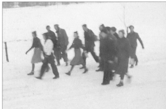
Det var en kold fornøjelse at vandre i de kolde besættelsestidsvintre som på turen til Lindknud den 2. februar 1941.