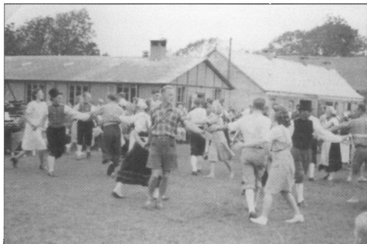
Så længe det var praktisk muligt var det populært blandt medlemmerne at holde høstfest på Bramming Hovedgård. I 1942 var vandrelaugets folkedansere også i sving. Foto: Niels Jespersen (Esbjerg Byhistoriske Arkiv).