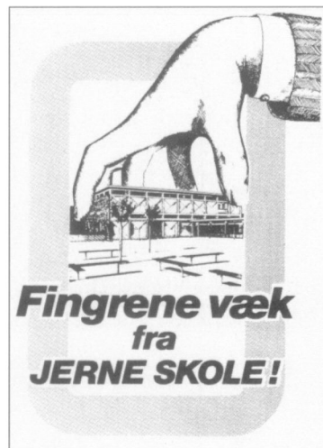
Tryksag fra kampen om Jerne Skoles bevarelse. Illustration fra hæftet Jerne Skole 1749-1989.

blev lavet klistermærker, streamers, bankospil og meget andet for at skaffe penge til kampen. Eleverne gik i protestmarch og hængte plakater op, og der blev lavet tegninger, som blev delt ud til alle distriktets beboere. Forældre samlede underskrifter for at fremtvinge en afstemning om skolen, hvilket resulterede i, at der den 17. marts 1981 blev afholdt en forpligtende afstemning om Jerne Skoles fremtid.