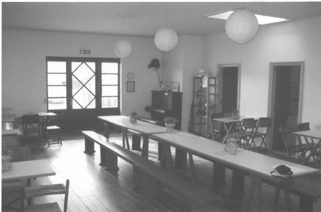
Fællesstuen med klaveret og langbordet er i princippet uændret i forhold til hvordan den så ud i 1937.