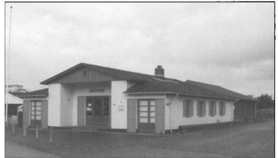
Vandrerhjemsbygningen Solfang fra 1937 er bevaret næsten uændret. Bag den ligger den nye afdeling fra 1982, placeret hvor den første barakbygning fra 1933 lå. Foto HP, dec. 2004.

Den nye hovedbygning indeholdt otte rum med fire køjer samt to rum med to køjer. I alt 36 køjer. Der var formentlig også en del sovepladser på loftet over køkkenet, men hvor mange vides ikke. I det store fællesrum var og er der ovenlysvinduer og i gavlen et stort vinduesparti med døre. To af firekøjes rummene