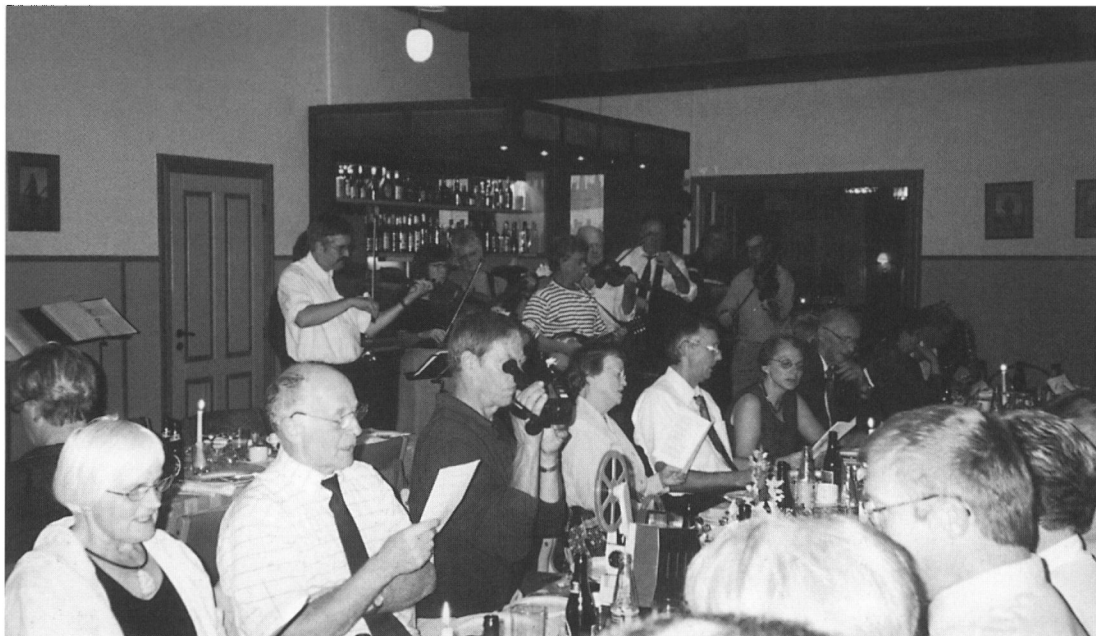
Lokalhistorisk Forening for Årre Sogn fejrede 25 års jubilæum den 20. september 2002 på Årre Kro. Der blev holdt foredrag og vist film og lysbilleder.