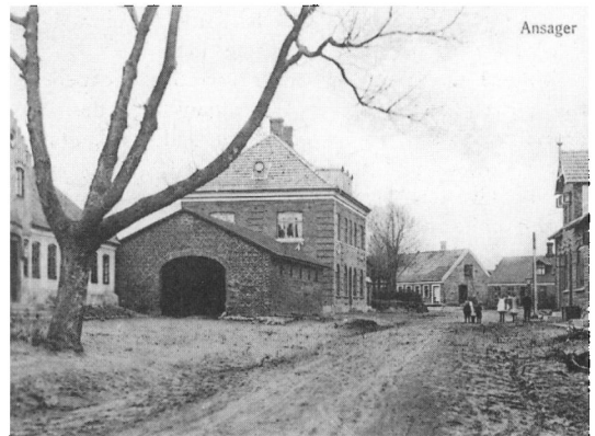
Postkort fra Ansager. Bygningen i midten er købmandsgården bygget i 1906.

Vi arbejder for tiden med omregistrering af de over 1.000 billeder, vi har liggende. Nyt materiel er det også blevet til. Således har vi fået et digitalkamera og en ny printer, hvilket inspirerede os til at lave en udstilling med billeder fra Ansager by før og nu. Endnu er den ikke helt færdig, men vi regner med at indbyde til åbning af den