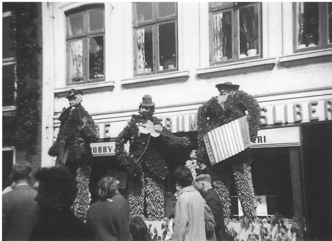
Tulipanfesten i Ribe fejrede sit 50 års jubilæum i 2002. I den anledning lavede Ribe Byhistoriske Arkiv en udstilling om emnet. Her ses et billede fra tulipanfesten i et af årene 1952-1960. I baggrunden skimtes Ribe Instrument Sliberi.