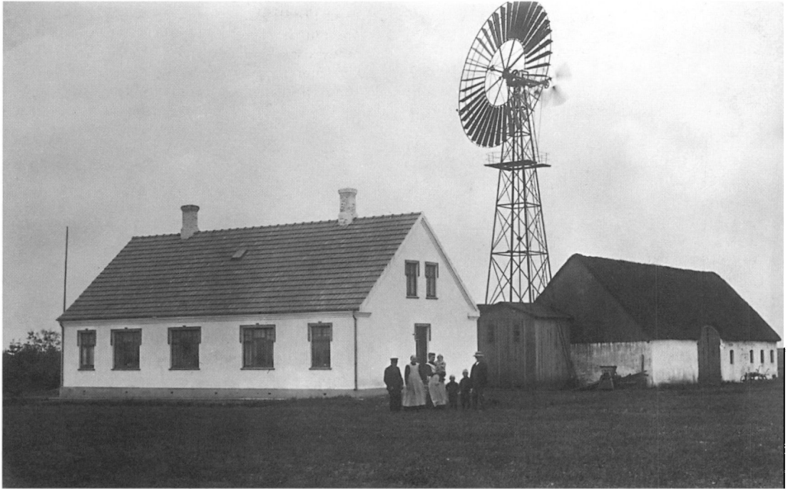
På Arkivernes Dag den 9. november 2002 havde Hejnsvig Lokalhistoriske Arkiv en udstilling med fotos af gård- og vindmøller fra perioden 1890-1930. En af gårdmøllerne fra Hejnsvig-området ses her.

er altid rart, når man kan få inspiration til, hvordan man ordner de ting, man får ind på arkivet.