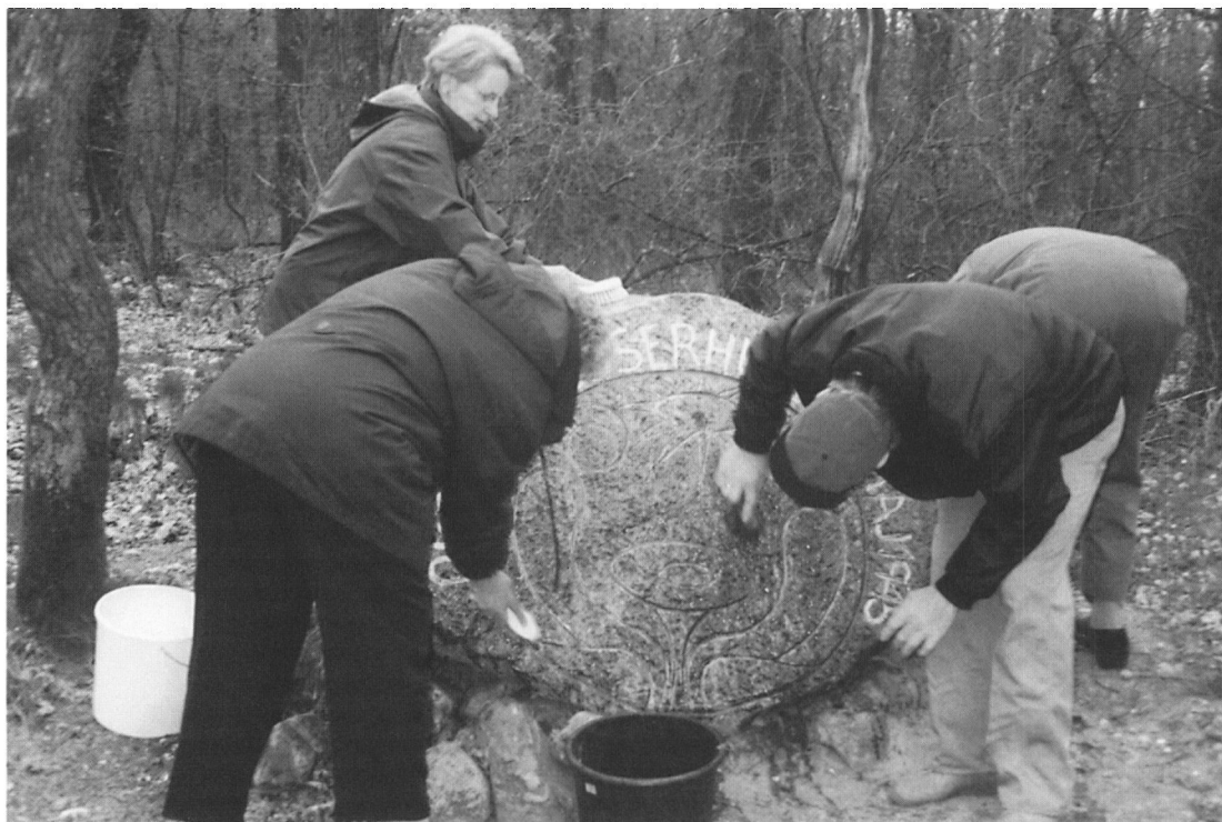
Hvert år den 4. maj rengøres mindestenen ved »russerhulen« i Grimstrup Krat, til minde om to russiske krigsfanger, der flygtede fra tyskerne under Anden Verdenskrig og skjulte sig i hulen.

Udflugten gik til Haderslev, hvor guiden fortalte om den gamle bydel. Vi sluttede i domkirken.