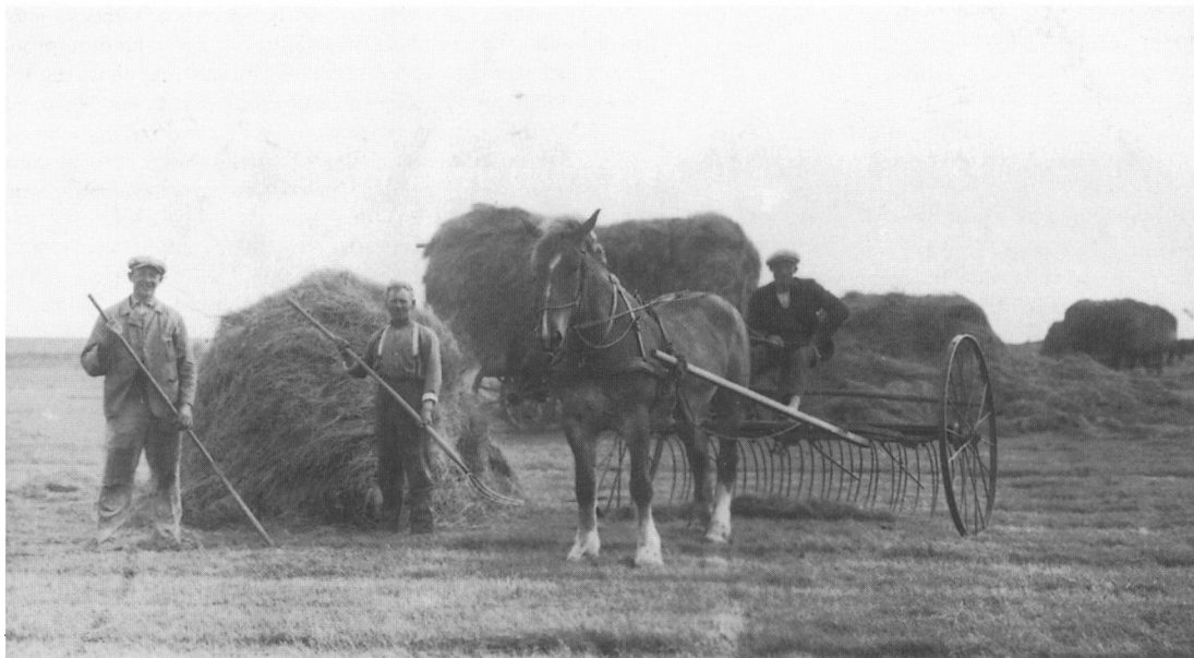
Der bjergeres hø – familie og venner hjælper. Ca. 1930.