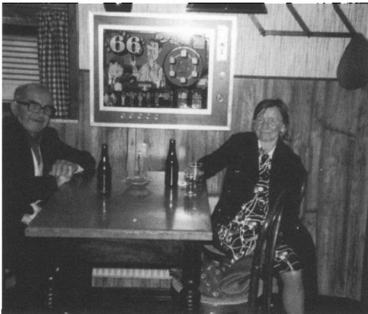
Stamgæster på Café du Nord i begyndelsen af 1970'erne. Det var en verden af stabilitet, tryghed, nærmest hjemlig hygge, der mødte en, når man gik ind gennem døren til caféen og blev mødt af kendte ansigter.

I køkkenet huserede i lang tid Birthe I og Birthe II, Ove og Børge, og iført nye uniformer,