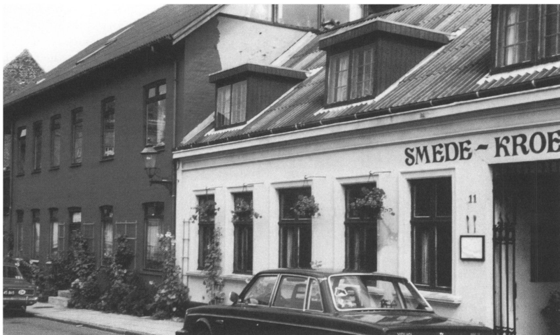
Smedekroen. Smedegade 11, 13 og 15. Indgangen til Smedekroen har gitter af Niels Houlberg. I stueetagen var indrettet kro-stue og på første sal selskabslokale. Det to en halv etages hus var en del af Smedekroen og rummede smedens Stue, Terrassestuen, Mellemstuen og Bjælkestuen. Yderst til venstre i billedet ses den åbne terrasse.

men i 1900. Han ombyggede stueetagen til to lejligheder og indrettede to loftsværelser med vinduer i gavlene.