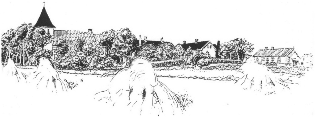
Føvling set fra syd. Bygningen yderst til højre er forsamlingshuset. Efter akvarel af Bjarne Johansen.

Så var den højtidelige og mindst spændende del af festen forbi. Lysene på træet var brændt ned, og nu blev det skubbet ned i en krog ved ribberne. Så skulle der leges sanglege, stadig under myndig ledelse af degnen. Vi skulle både gå rundt om en enebærbusk, skære havre og løbe med ræven rask over isen. Til sidst kom kong Gustavs skål. Den hørte åbenbart til de svære og indviklede sanglege, for den måtte kun de store, degnens klasse, være med til, og