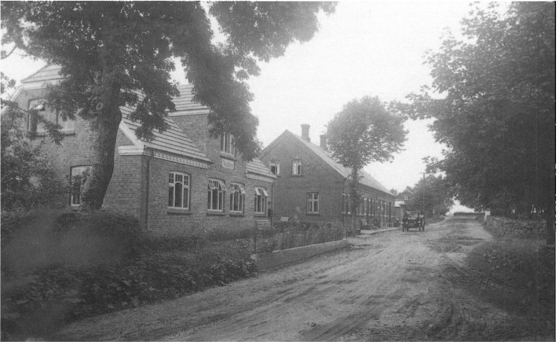
Føvling Afskoldshjem, som blev købt i 1948 og udbygget til forsamlingshus.

Der var som regel altid fire hold, et pigehold, et karlehold, et småpigehold og et drengehold. Der gik et brus gennem salen, når porten til den lille sal blev rullet fra, og ind marcherede et stort hold af karle eller piger med fanen i spidsen. De sang, så huset rystede. Det