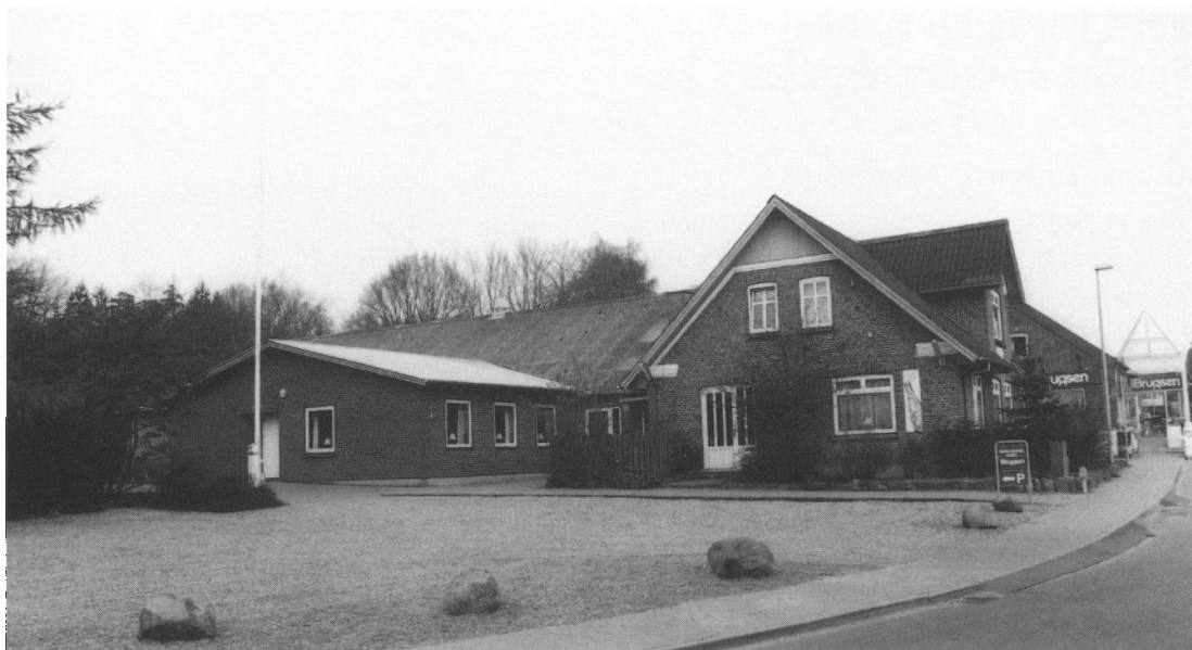
Førling Forsamlingshus som det ser ud i dag. Foto: Hans Peder Hansen 1999. Udlånt af Lokalarkivet i Holsted.

hest, en kokosnedspringsmåtte og to rullemadrasser, der efter mange års brug bidrog stærkt til at give forsamlingshuset sin karakteristiske lugt.