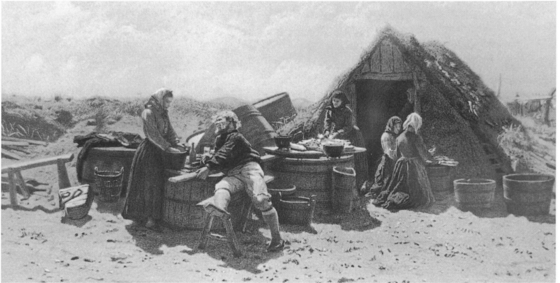
L. Tuxen: Solskinsdag mellem fiskerboderne ved Nymindegab.

bemandet med dansk mandskab. Den var let armeret for at tjene i transportfart og skulle nu til søs. Vi blev da to mand beordret til at gå i lods båden til den gamle lods for igen at gå ombord i nævnte fartøj for at lodse den over Barren 9 ud i rum sø. Som vi var vel ankommet og lagt vor lods båd agterud, blev der, efter at ankeret var hevet op til spring, varskoet mandskabet »til vejrs at gøre sejl los«. Under denne manøvre faldt en mand ned fra bramræen og traf med hovedet mod »druen« 10 på en kanon og slog sig, så han straks døde 11 . Det blev så ikke noget af at komme til søs den dag. Der blev en sørgelig forstyrrelse ombord. Den døde blev bragt i land for at begraves på Nordby Kirkegård på fjerde dagen. Han blev fulgt af alle sine krigskammerater og flere til. Ombord var flaget hejst på halv stang, og kanonskud blev afgivet. Mange flag sås på halv stang den dag. Samme dag som begravelsen var forbi, rustede