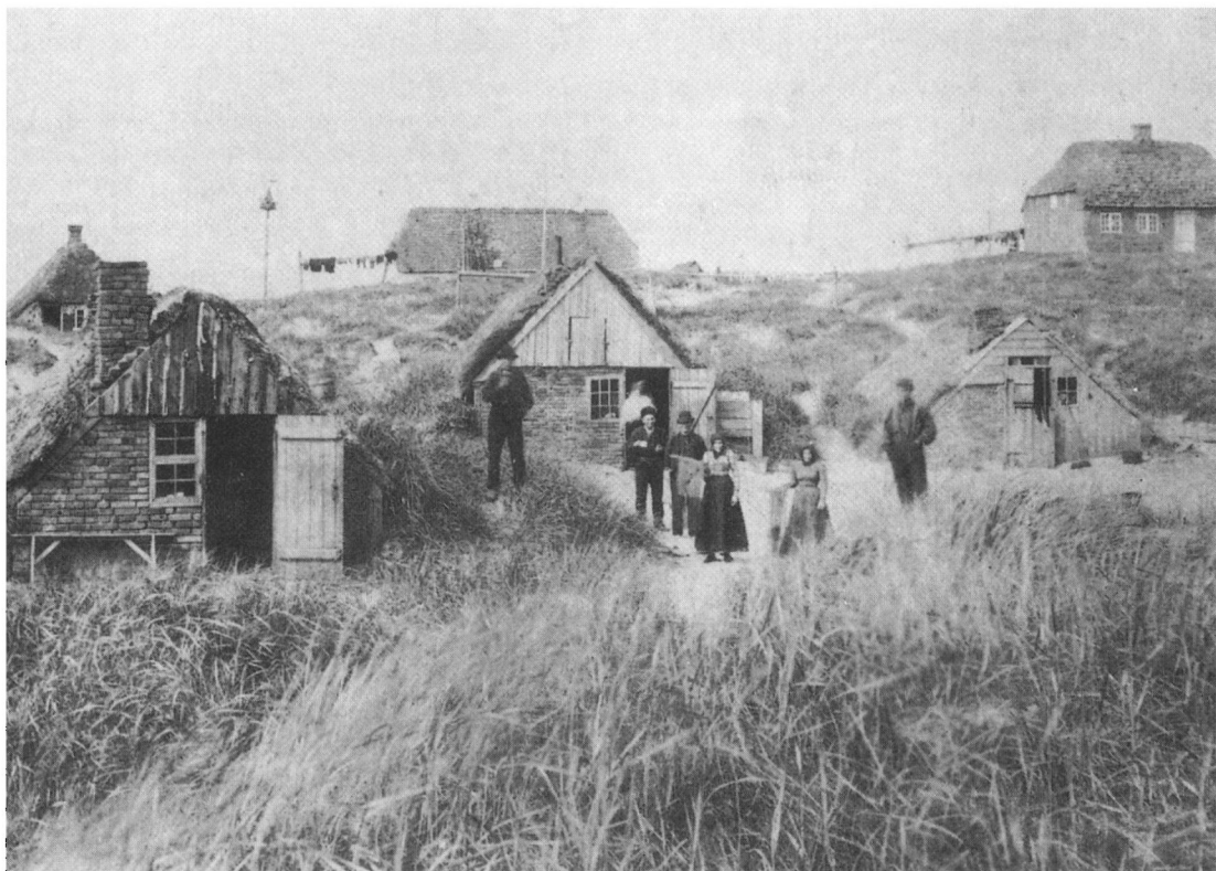
Udsnit af fiskerboderne ved Nymindegab. Efter Sigurd Enggård Poulsen. 1981.

Vort arbejde bestod i høbjergning, og det stod på i to til tre uger. Der var stor udstrækning af marskenge, men ingen gest. Foruden den mængde hø vi bjergede, blev der solgt og leveret 10-12 læs hø til Sønderland, hvor der ingen eng var. Vi to mand gjorde det på den måde, at vi stod op om natten kl. 1, til hvilken tid de to ældste døtre vågnede for at kalde på os og for at have kaffen færdig. Vi havde vores eng ude i nordøst, ca. 1000 alen fra gården, hvor vi begyndte og endte i 1½ fjerdingssvejs afstand. Her ude brugte vi så høleen fra kl. 2½ om morgenen til kl. 9. Så kom den