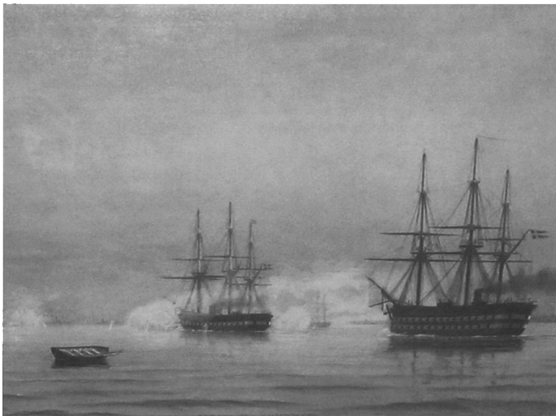
Linieskibet »Skjold«. Slaget ved Rügen 1864. Maleri af Chr. Blache, Orlogsmuseet.

I april 1850, da der kom indkaldelsesordre, måtte vi vende næsen mod København. Vi mødte i Fredericia for med transportdamper at gå videre til København. Det kneb for os to forlovede at skilles, for derfra kunne jeg ikke gøre en smut hjem for at besøge hende, og det var i så fald forbunden med stor fare. I Guds navn skiltes vi og bad i hans navn til, at vi kunne mødes igen. Vi kom for sent til Fredericia og måtte derfor indkvarteres hos borgerne. Det varede i ti dage, inden der kom en damper igen. Jeg kom til at træffe sammen med en