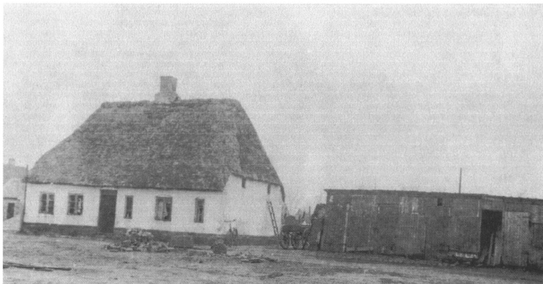
Huset der indtil 1884 var hovedskolen i Sønder Omme og som fra 1888-1936 blev anvendt som fattighus.