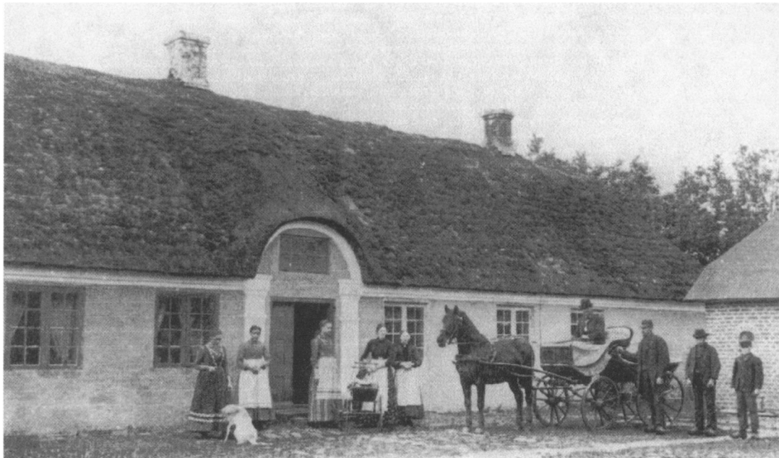
Sønder Omme præstegård da Vilhelm Birkedal boede der.

hus, på modsat side af vejen. Thøger Christensen i Stakroge opførte fattighuset af fem fag egebindingsværk med lerklining. Prisen var 30 daler holstensk kurant. Der var tag af nyt strå, fem nye døre, to kakkellovne og to nye sengesteder. I 1838 blev der bygget tre fag til.