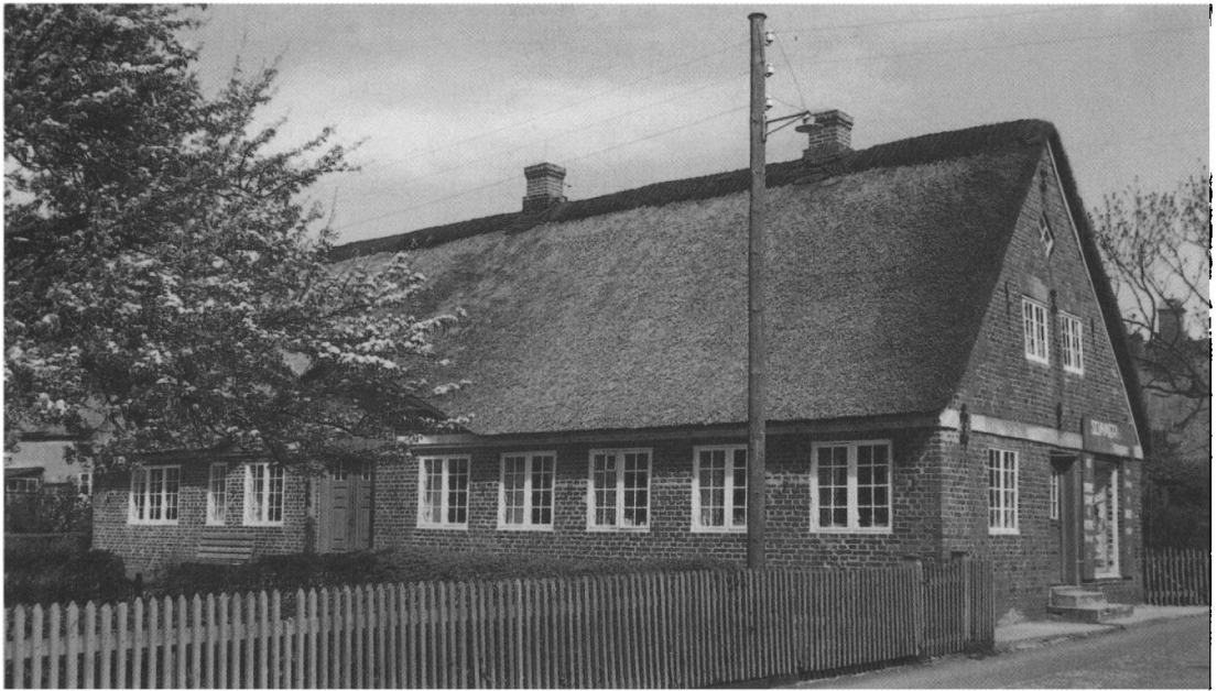
Hjemmet, Hovedgaden 41, i Nordby, til venstre ses grene fra det store pæretræ.

De mødtes gerne disse tre søstre i det gamle hjem i denne mørkningsstund og fortalte om, hvordan det havde været i gamle dage. De drøftede også, hvad nyt der var i byen m.m.. Der var intet traktement, de satte sig roligt hver på sin plads. Efter en times tid gik de igen. Om vinteren, når far var hjemme, blev der sunget gamle viser, fortalt om ligskarer og varsler, så vi børn var ganske skræmte. Først når 7-damperen kom ind, måtte lampen tændes.