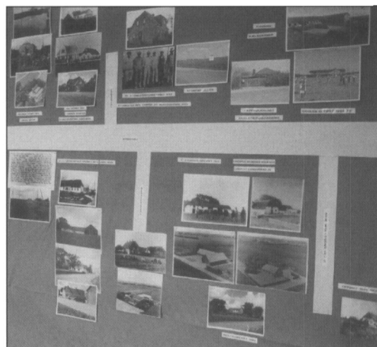
Janderup Lokalhistoriske Arkivs deltagelse i udstillingen Folk og Kultur på Janderup Skole i år 2000 med billeder af gårde og huse fra Nybrovej 1-70.

Arkivet har i årets løb modtaget 106 afleveringer. En af de interessante afleveringer var Janderup Andelskasses arkivalier. Der har været 79 besøgende, og for de flestes vedkommende gjaldt interessen deres rødder her i sognet. Der kan nævnes to personer fra Canada, to