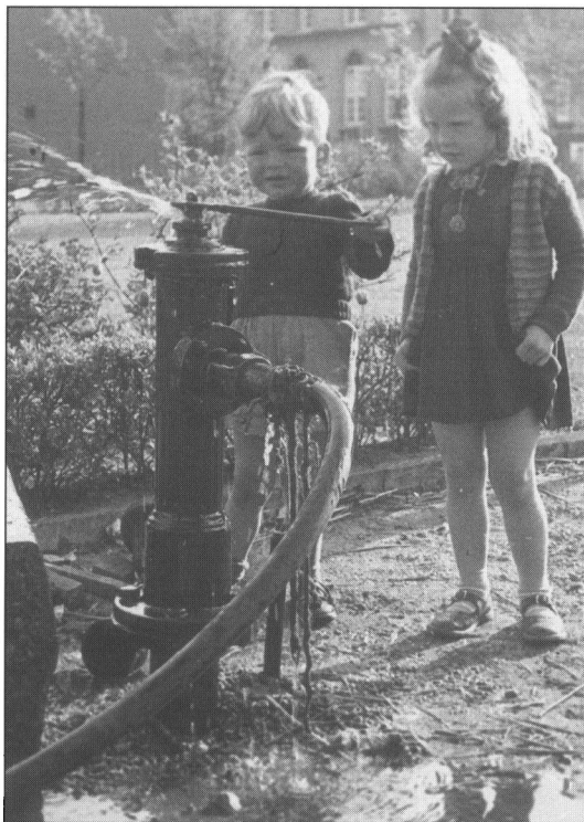
To børn leger med vand fra brandhane, 1952. Fotografiet blev brugt til plakaten for Alle tiders Børn.

Til arkivets formidlingsaktiviteter i øvrigt hører også udgivelse af bøger samt udstillingsvirksomhed. Hvis man ser bort fra Esbjerg kalenderen, der udkom som altid i midten af november, lå udgivelsesvirksomheden stille i 2000. Dog blev det i sommerens agurketid til en række artikler i JydskeVestkysten om Esbjergs historie gennem 100 år fortalt i ti-år samt en artikelserie om fotodokumentation, som ikke blot løb i sommermånederne, men også omkring jul og nytår. Til gengæld var der god aktivitet og nye initiativer på udstillingssiden. Der var nemlig tale om et samarbejde med Det Centrale Børnebibliotek, A. Pushkin i St. Petersburg. Det havde stået på siden 1998 og var led i det, der var begyndt som et gensidigt kulturudvekslingsprojekt mellem Esbjerg og St. Petersburg i 1998, og som kulminerede i oktober 2000 med St. Petersburg Festivalen, hvor mange russiske kunstnere gæstede Esbjerg og Ribe Amt. Esbjerg Byhistoriske Arkiv fastholdt, at der var tale om