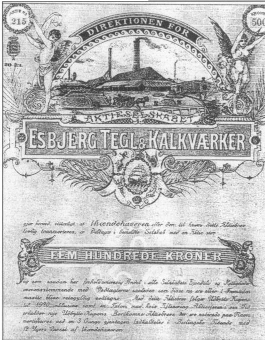
Aktiebrev fra et konkurrerende teglværk 1896.