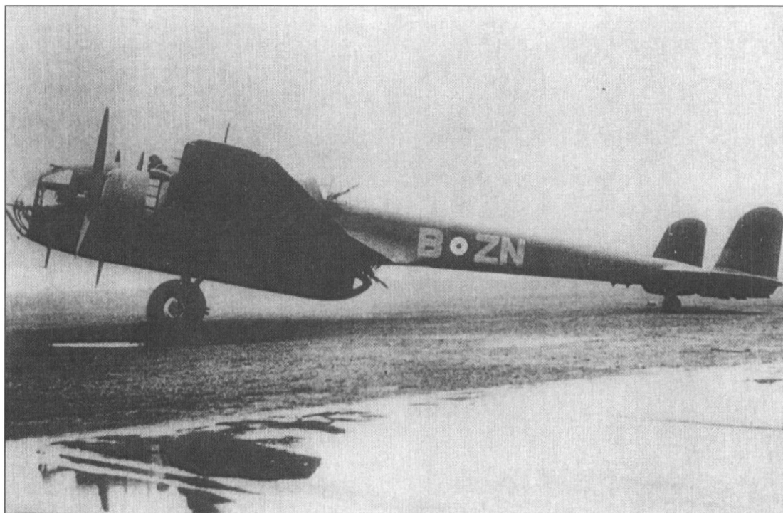
Fly af typen Hampden. Det var et fly af denne type, der styrtede ned ved Nordenskov i januar 1942.