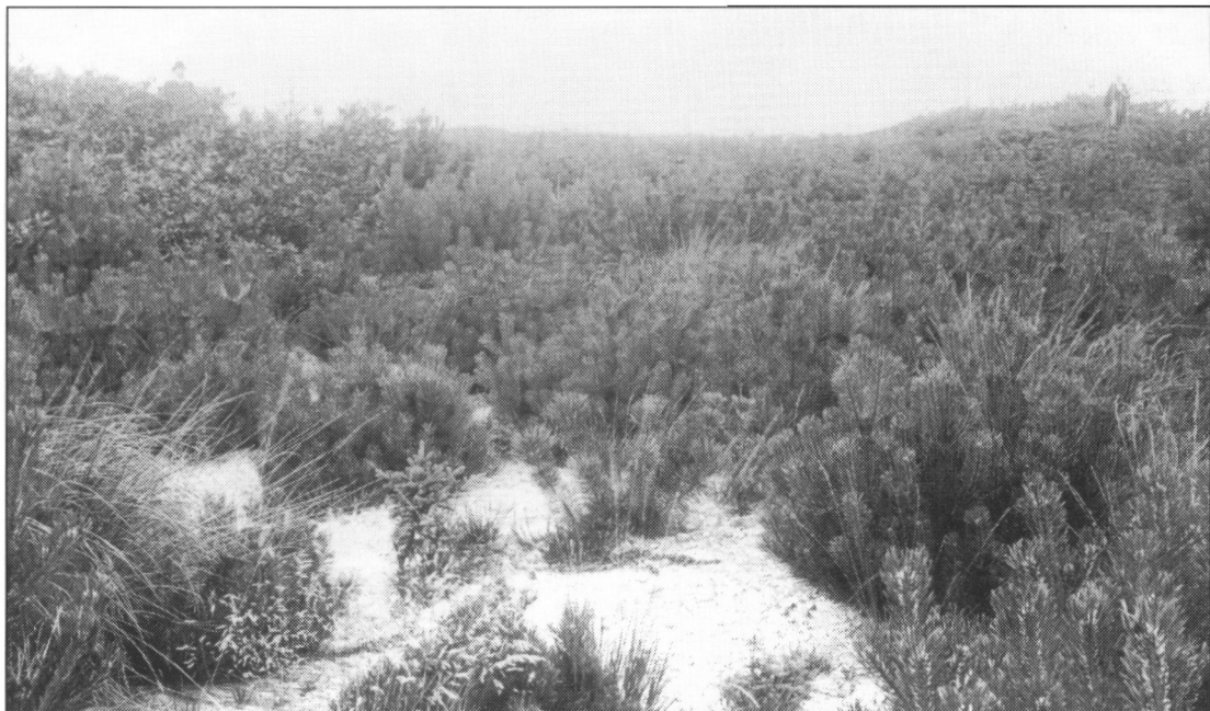
Billede fra retterstedet på lyngheden i Varde Sandgrave, hvor forfatteren formoder henrettelsen fandt sted den 9. februar 1822. I baggrunden til højre skimtes historieskriver Murtfeldt.