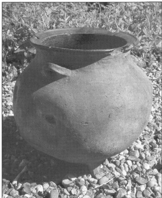
Jydepotte fremstillet på gården Foldager i et af de nye pottesogne, Ølgod.

Inden for de tre sogne var jydepotteproduktionen en integreret del af snart sagt ethvert bondebrug, og det var en nødvendighed for at drive et landbrug i området, at det blev suppleret med pottefremstilling. Det var stort set kun i de tre sogne, kvinderne forstod at gøre potter, som man sagde, og efterhånden blev det et problem at finde sig en ægtefælle, som man ikke var beslægtet med. Da der skulle betales afgift, hvis man skulle søge om dispensation til ægteskab mellem slægtninge i tredje led, ansøgte præsten i 1762 om, at beboerne i Torstrup og Horne blev fritaget for den afgift med den begrundelse, »at kvindekønnet i disse sogne fra deres ungdom bliver oplært at forarbejde de såkaldte jydepotter, hvorfor de sjældent giftes uden for sognene, ligesom også mandkønnet