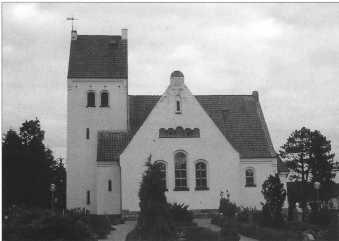
Lønne nye kirke, der indviedes den 4. december 1904.