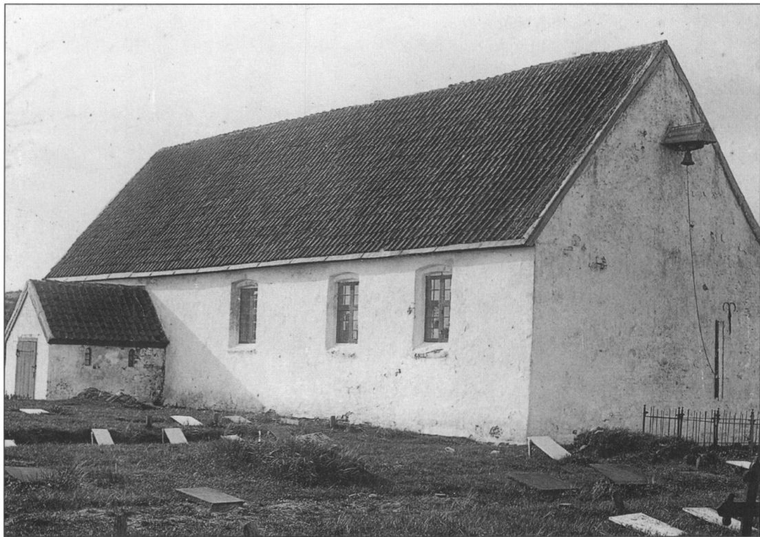
Lønne gamle kirke, der af lokale folk kaldtes »æ foresti«.

Efter de anordnede skriftsprog ved kirkeindvielser var læst af fire præster, foretog biskop-