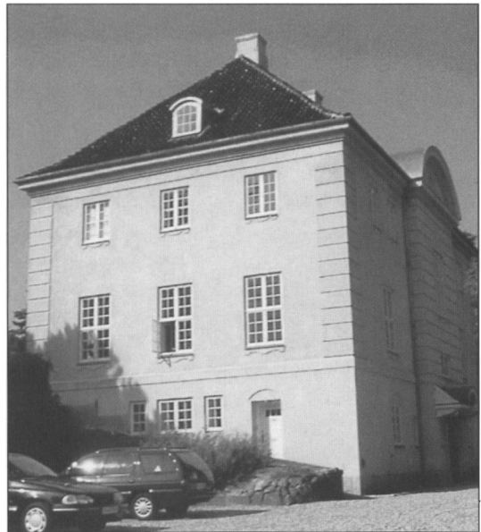
Villa Zoar i Fredensborg, set fra indkørselen.

Samtidig med Magdahl var i gang med denne store opgave, havde han sideløbende andre mindre opgaver. Han byggede flere villaer, deriblandt den store Zoar i Fredensborg. Villa Zoar ville blive genbo til slottet, hvorfor bygherren ønskede den opført i en stil, så den ikke af-