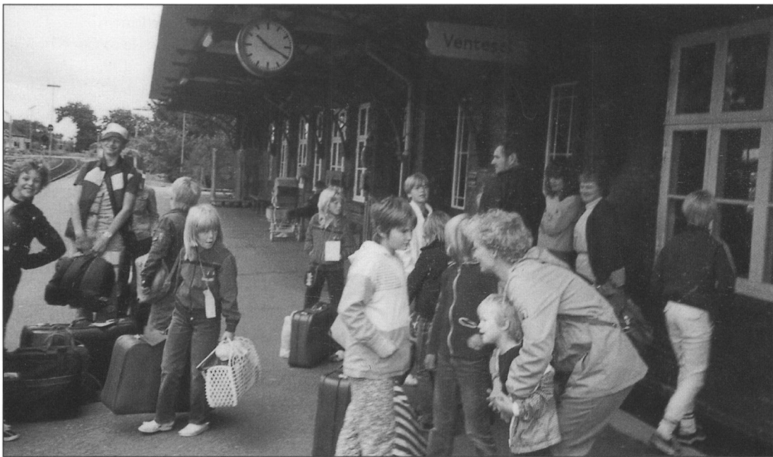
Glade og forventningsfulde børn på Flensborg Banegård før afrejsen til ferieopholdet i Danmark. (Foto: Privateje).

Straks efter genforeningen i 1920 dannedes Grænseforeningen som en landsforening, hvis formål var at videreføre det arbejde, de Sønderjyske Foreninger allerede havde udført gennem mange år under det tyske herredømme. De sønderjyske foreninger, der var spredt over