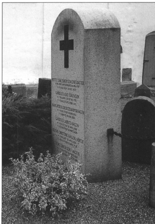
Gravmonumentet over familien Hagen på Jernved Kirkegård.