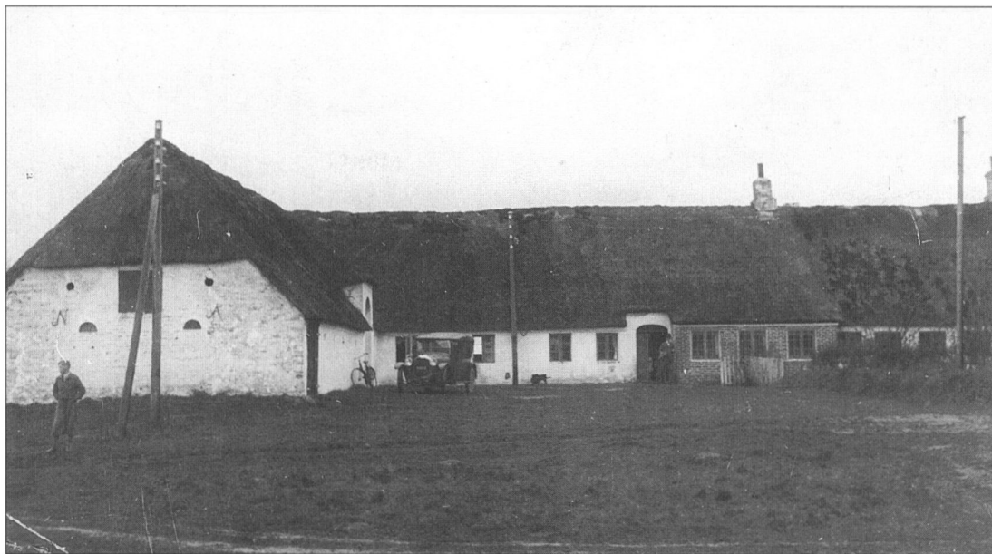
Gården i 1924.