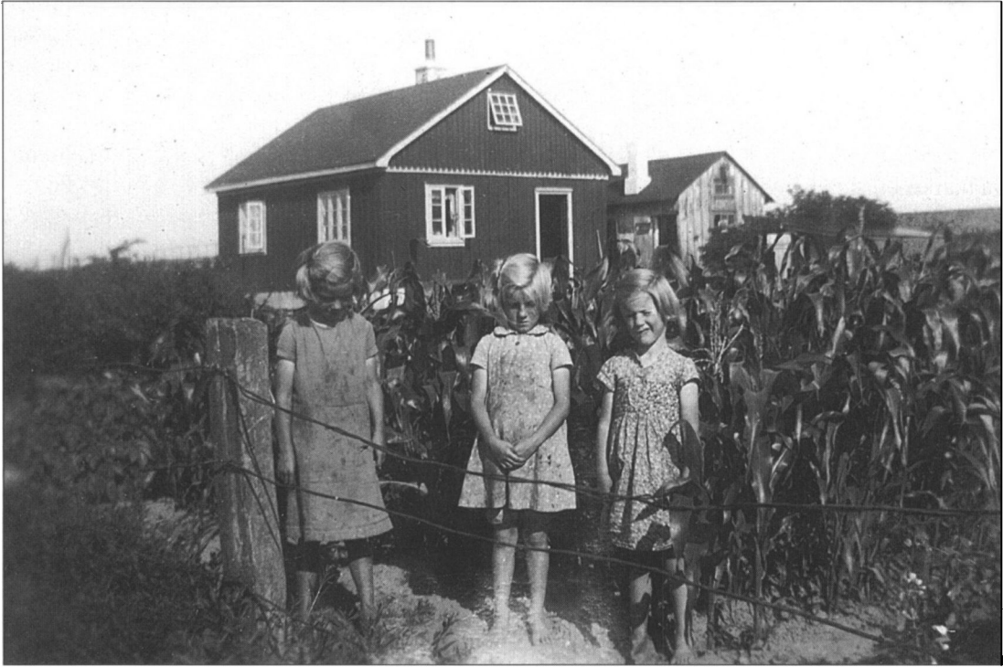
Tre af mine søskende foran vogterhuset i Sneum.