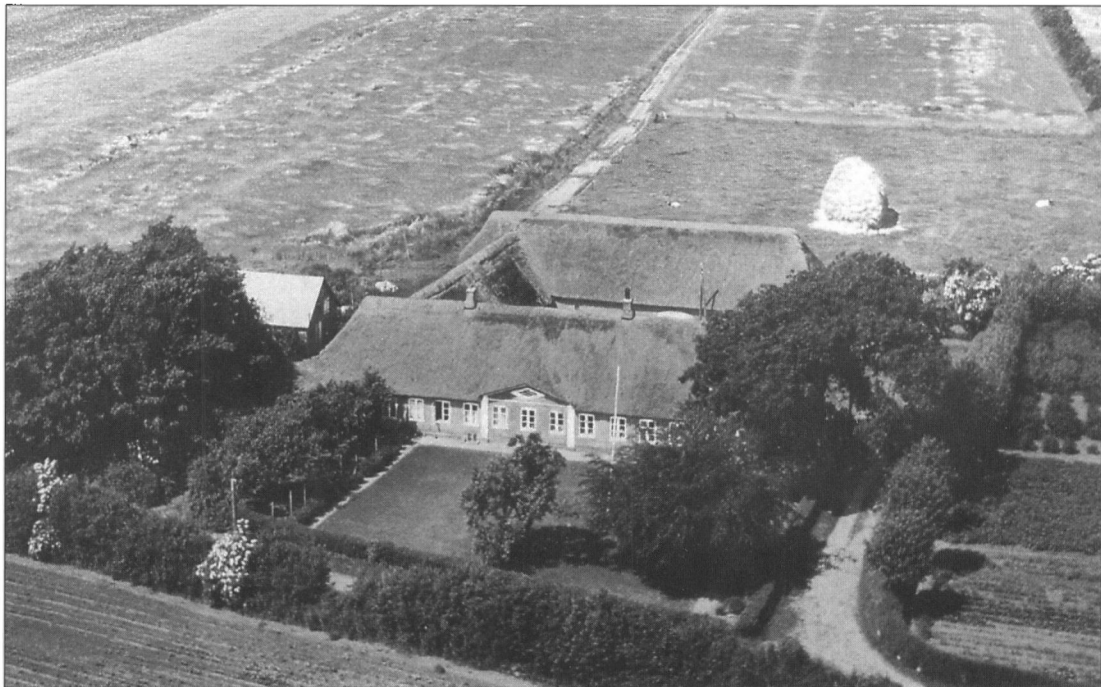
Gården i Hunderup, Nørlundvej 6, Hunderup.

hjemmet i møde som en uafvendelig kendsgerning og som en skæbne, jeg nu engang måtte bære. Vi var 10 børn i hjemmet, og jeg var den yngste af fem drenge. Min far var arbejdsmand. I de strenge vintre i begyndelsen af 1940'erne arbejdede han med at rydde sne for kommunen, om sommeren huggede han skærver til vejarbejde. Lønnen var beskedent, og i perioder var der slet ikke noget arbejde. Min mor var en stærk kvinde, og hun hjalp godt til - hun hakkede roer på gårdenes marker, og hun stablede tørv i mosen. Men der var jo mange munde at mætte. Meget ofte stod der rabarbergrød, kartofler og stuede kålrabi på middagsmenuen, for der var ikke