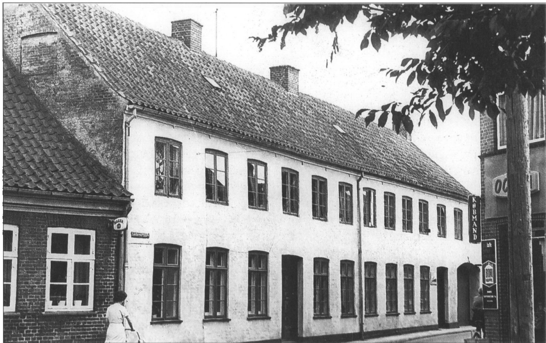
Huset i Sønderportsgade der tidligere var gæstgiveriet Sorgenfri.

Vejle 1 . Men Conrad Wedel blev ikke holdt til bogen - i modsætning til en ældre broder Thomas Wellejus, der senere blev præst i Sønder Omme.