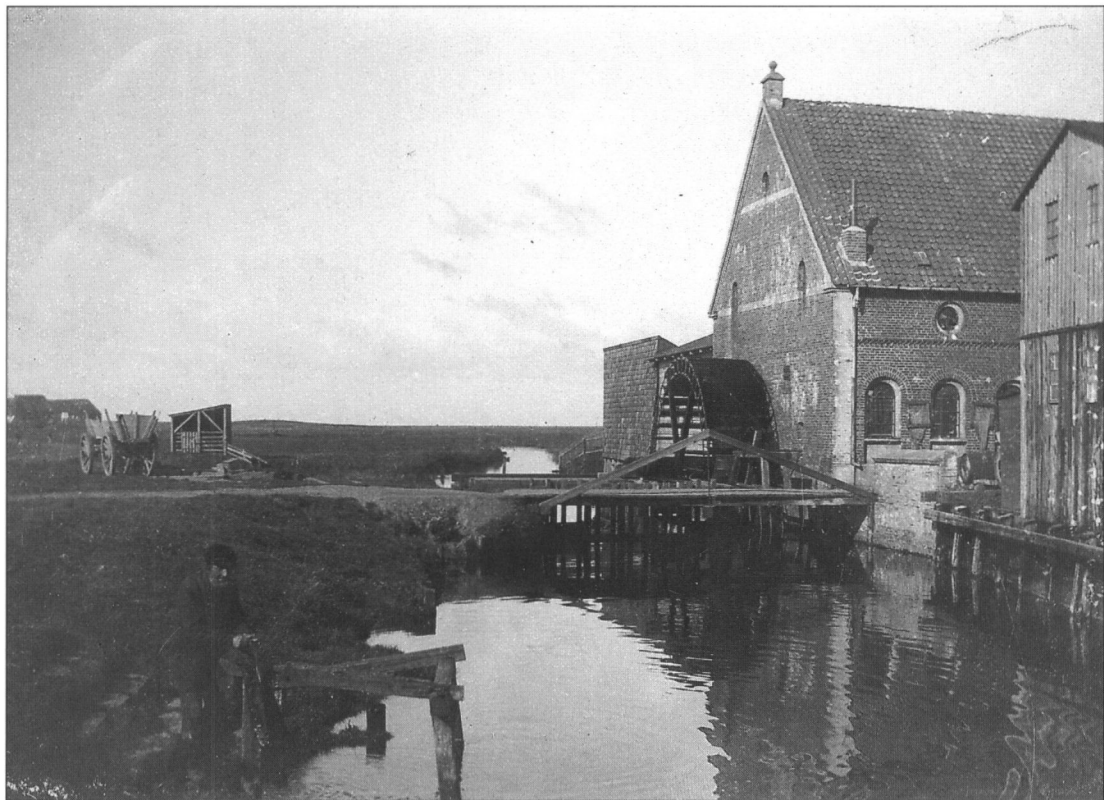
Sønderportsbro i Ribe 1913.

lød ved daggry til tappenstregen eller re-træten kl. 20 eller 20.30.