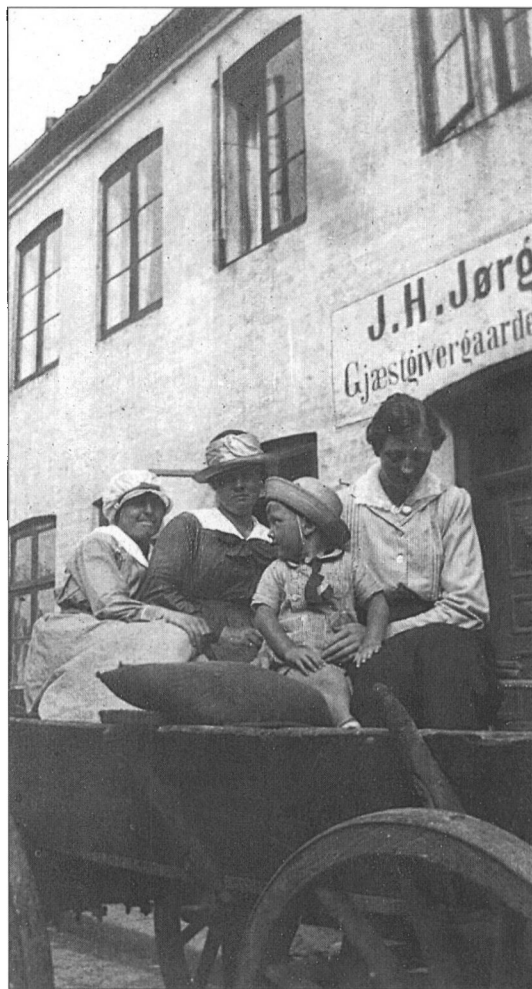
Københavnske besøgende foran gæstgivergården ca. 1922.