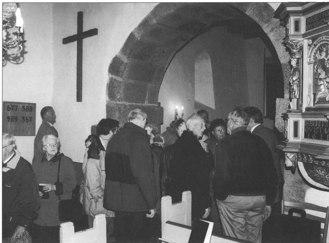
Efterårsmøde i Årre Kirke.