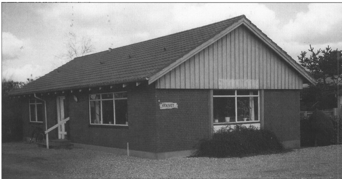
Vesterled 46 i Janderup, hvor Janderup Lokalhistoriske Arkiv har til huse.

linger og forfatterskaber såsom: Flere slægtshistorier, barning, sagn, overtro, omflakkende folk, natmænd, tiggere, fattigvæsen, varsler, børnerim, børnelege, begravelsesskikke, ligsyn, bryllupper, remser om vejret, barometermagere, spøgelse og mange andre ting.