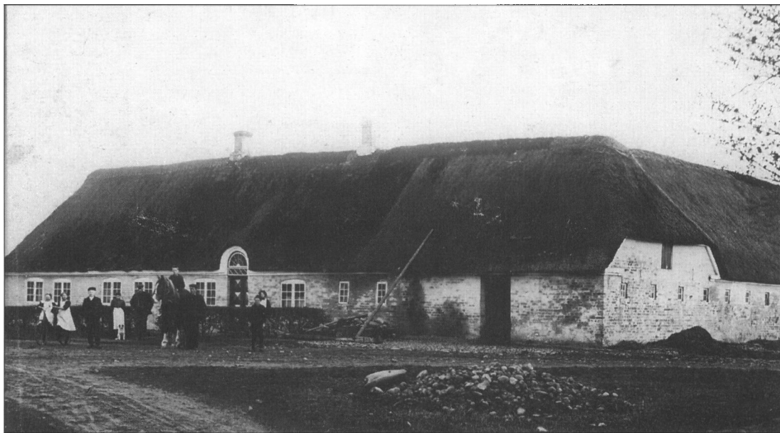
Sønderbyvej 21, Darum Sønderby. En af de gamle marskgårde i Darum Sønderby. Dele af det nuværende stuehus kan føres tilbage til slutningen af 1700-tallet. Ejerne kan føres tilbage til 1688. (Darum Sognearkiv).

Arkivet har haft 8 besøgende i åbningstiden samt en del henvendelser derudover, blandt andet fra slægtsforskere fra ind- og udland. En 6.-klasse fra Darum skole, der arbejdede med emnet "Darum før og nu", fik hjælp fra arkivet.