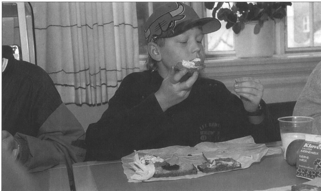
Oslo-frokosten fortæres åbenbart med største velbehag! En elev fra Boldesager Skole i Esbjerg spiser sin skolebe- spisningsmadpakke, som er blevet lavet i forbindelse med afviklingen af klassens projekttuge, der var afslutning på efterårets lokalhistoriske undervisningsforløb. November 1996.

række større og mindre afleveringer, som hver især bidrager til Esbjergs historie. Feks. har samarbejde med aktive borgere i Tjæreborg og Boldesager-området ført til en vældig udbygning af arkivets fotosamling fra de to steder.